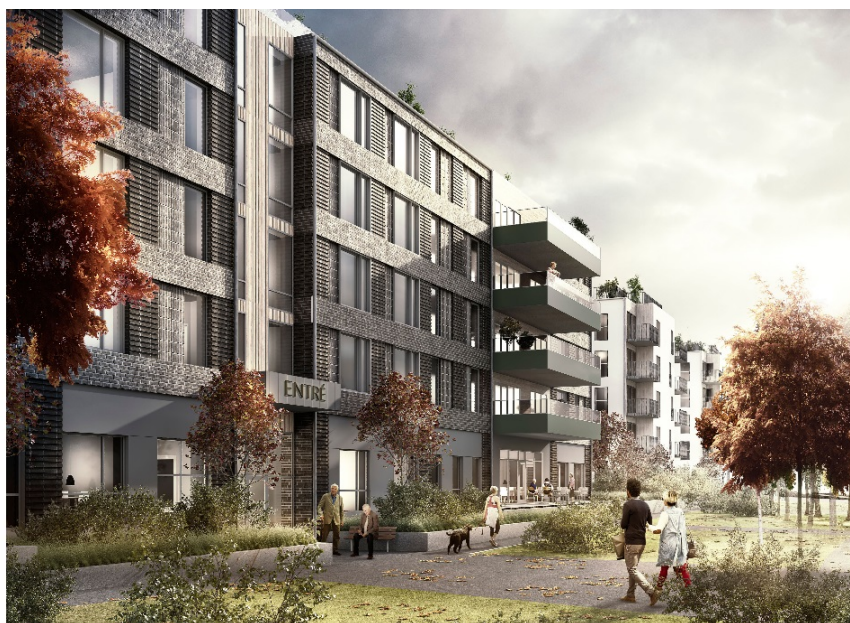
Vårdbyggnaden och entréhusen (Krook & Tjäder).

Ett bostadshus i fem våningar föreslås öster om vårdbyggnaden. Byggnadens fasader föreslås vara i ljus puts med de två nedersta våningarna i skiv- och trämaterial. En gemensam uteplats planeras på byggnadens tak. Detaljplanen möjliggör även för eventuellt korttidsboende med medicinsk vård i byggnaden.