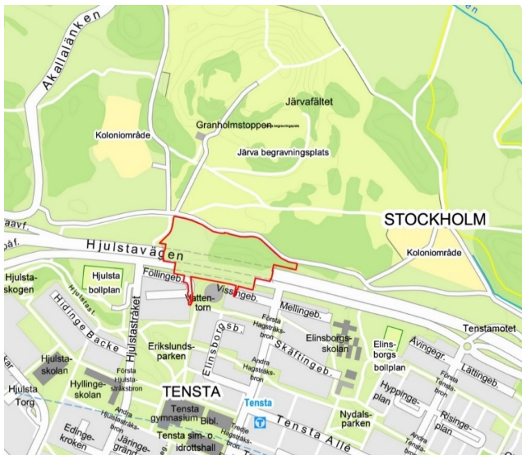
Karta som visar planområdets avgränsning med röd linje.