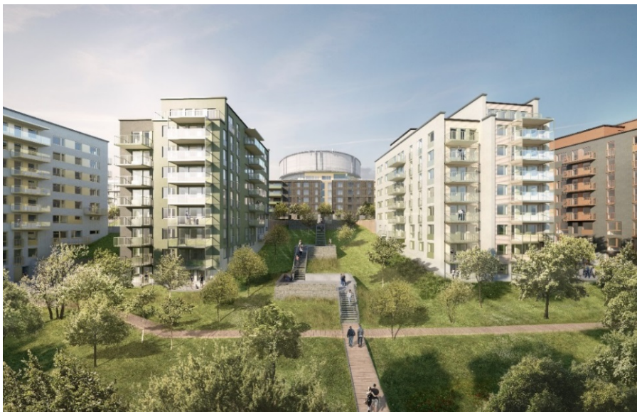
Park med trappa upp till Tenstaterrassen. Vattentornet i fonden (ÅWL arkitekter).

fickor på entrétorget. På grund av stora höjdskillnader, har det inte varit möjligt att uppnå full tillgänglighet mellan terrassen och fältet. En gång- och cykelväg har ingående prövats men en strategisk ledning som varken kan flyttas eller överbyggas har hindrat en sådan lösning. Förutom kostnads- och driftsskäl har en hiss inte bedömts som lämplig då enda läge är i ett undanskymt och potentiellt otryggt läge bortom det västra garaget vid tunnelmynningen, närmare 100 meter från GC-vägen på fältet.