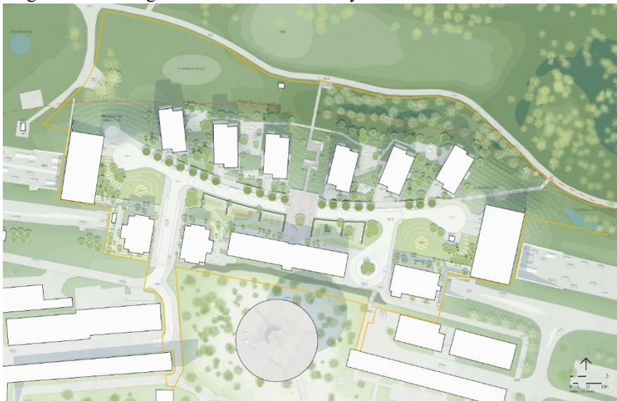
Bebyggelsens placering ovan E18. Järvafältet i norr och Tensta runda vattentorn i söder. (Sweco Architects)

Förslaget innebär att drygt 320 bostäder och ett vårdboende med närmare 80 bostäder kan uppföras. Planförslaget reglerar att 12 byggnadskroppar placeras i anslutning till Tenstaterrassen. Närmast tunnelmynningarna placeras parkeringsdäck i två till tre våningar som även utgör buller- och säkerhetsskydd mot trafikleden.