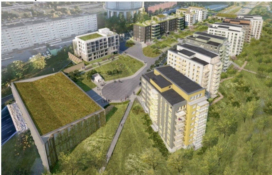
Flygvy mot sydväst (ÅWL arkitekter).

Norr om angoringsgatan i slutningen ner mot Järvafältet föreslås sex husvolymer med sex våningar mot den svängda lokalgatan och nio våningar från fältet (tre våningar i suterräng). Antalet bostäder är drygt 240. Bostadshusen placeras med entréer mot gatan. Vid tunnelmynningarna för E18 placeras parkeringshus som även utgör buller- och riskskydd mot motorleden.