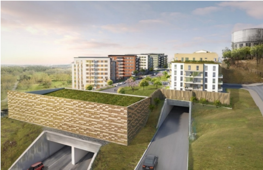
Västra garaget, bostadshusen samt bullerplank (ÅWL).

Bostadsparkering sker i parkeringsgarage ovan tunnelmynningarna. Garagen har fyra funktioner: parkering för bilar och cyklar, bullerskärmar, skydda bostäderna för en olycka i tunneln samt annonsera den nya Tenstaterrassen. Garagebyggnaderna förses med en fristående fasadkonstruktion där formspråk, material och kulör ger en unik kombination för respektive garage.