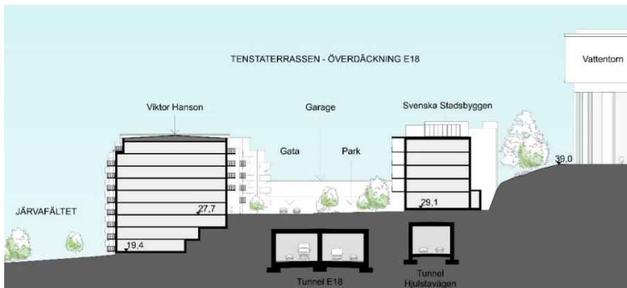
Sektion genom Tenstaterrassen (ÅWL Arkitekter).