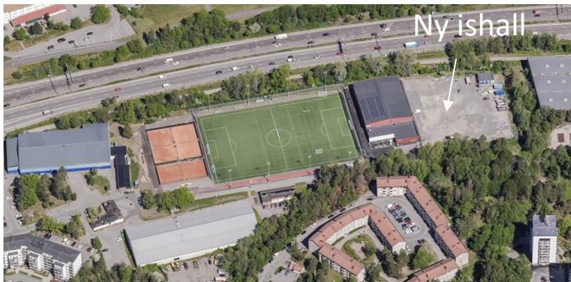
Flygfoto över Mälärhöjdens IP

Idrottsnämnden godkände i april 2022 ett hyresavtal för två nya ishallar på Sättra IP under förutsättning att kommunfullmäktige beslutar i ärendet. När de nya ishallarna byggs på Sättra IP behöver verksamheten evakueras, vilket kommer att ske till den planerade ishallen på Mälärhöjdens IP. Tidplanen har därför anpassats så att det kan ske en tillfällig evakuering av verksamheten från Sättra ishall.