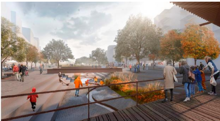
Perspektivbild på skyfallsrännans möte med stadsdelstorget. Illustration: White arkitekter.

En viktig utgångspunkt för torgets gestaltning har varit att säkerställa att kommande skyfall når Årstafältets dammar. Detta görs genom en ränna som dras genom torget och ned genom Stadsdelsparken. Genom att bejaka rännan som en del av den arkitektoniska idén och låta den bli en tydlig del av torgets identitet har dagvattenhanteringen blivit utgångspunkt för torgets gestaltning. Rännan är bland annat utformad med sittbara kanter av granit som inbjuder till lek och rörelse och bidrar till att stärka stadslivet.