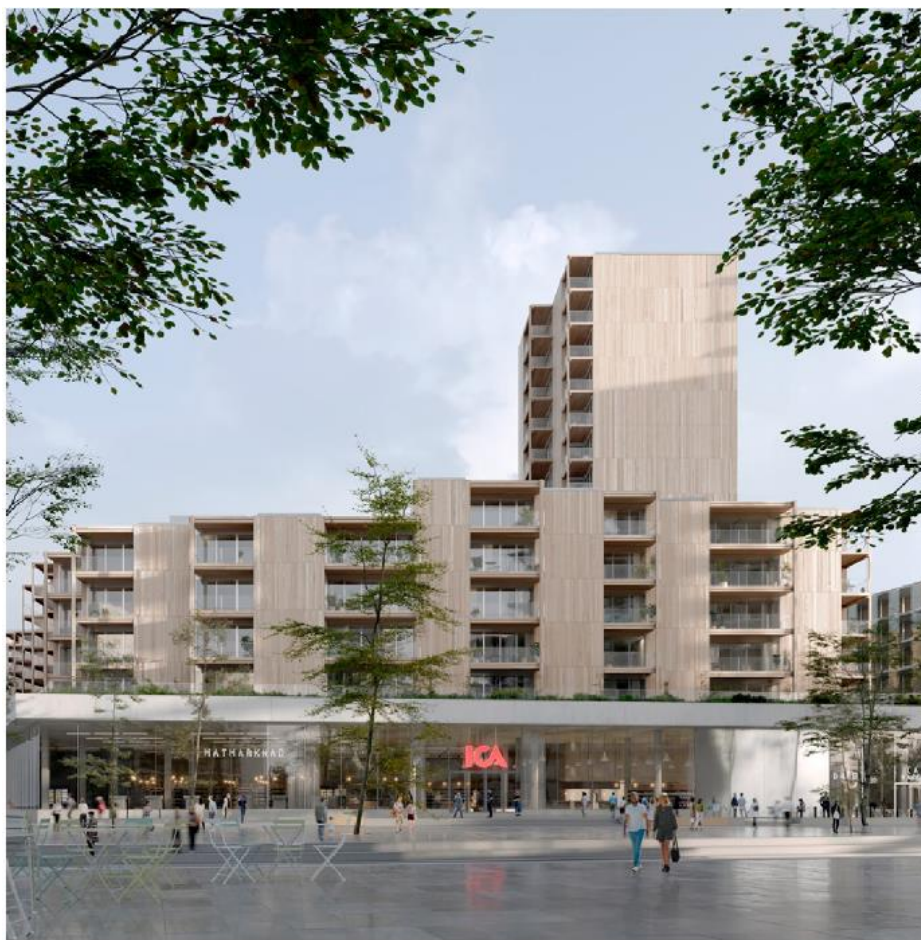
Kvarteret sett från torget. Mot torget föreslås livsmedelsbutikens entré ligga. Illustration: Arrhov Frick arkitekter

Kvarterets bottenvåning inrymmer en stor livsmedelsbutik med en huvudentré mot torget. Den arkitektoniska idén för kvarteret handlar om att i ett så stort kvarter skapa en livlig, öppen men samtidigt robust sockelvåning med plats för handel och publika verksamheter. En viktig del i utformningen är även den varierade och flexibla bostadsbebyggelsen ovanpå sockelvåningen, som utgör en stadsträdgård. Bostadsvolymerne är placerade i nordsydlig riktning vilket ger ett naturligt och skiftande indra från sockelvåningen. Detta bryter ner volymernas skala och möjliggör för en blandning av privata och gemensamma grönområden som vänder sig mot gatusidan med syfte att främja gatulivet.