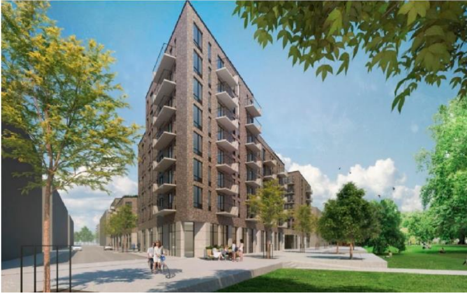
Kvarter D sett från parken.