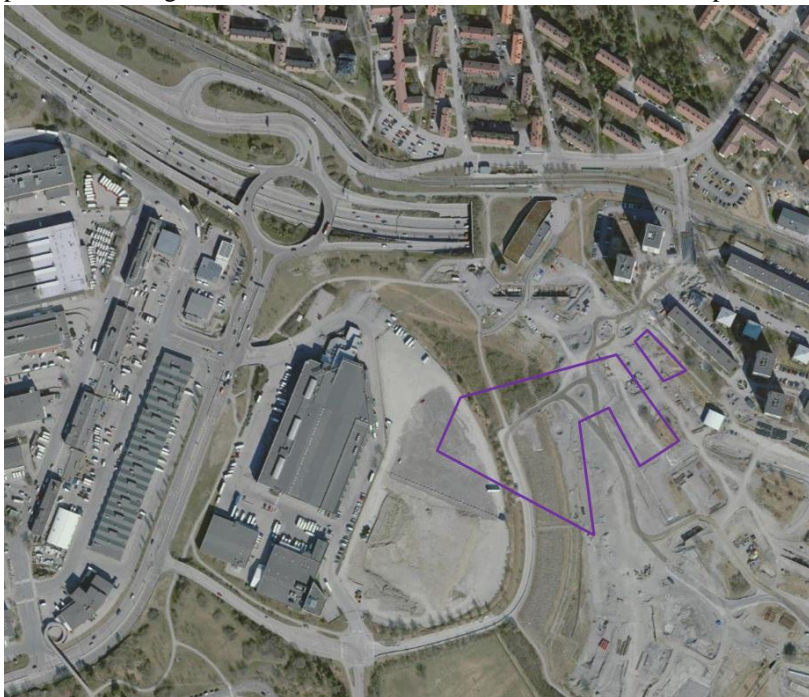
Ortofoto med planområdet markerat i lila.

Planområdet är beläget på Årstafältet och angränsar till bostadsområdena Valla gårde och Årsta, en mindre logistikverksamhet intill Årstafältet samt verksamhetsområdet Årsta Partihallar. Planområdet utgörs idag av Årstafältet samt ett mindre verksamhetsområde där det tidigare funnits en större lager- och kontorsbyggnad som nu är riven. I planområdet ingår även en elnätsstation. Planområdet har en areal på cirka 2,6 hektar.