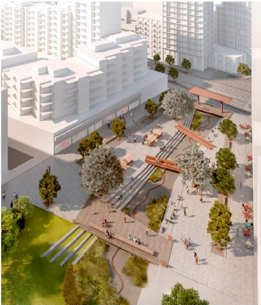
Vy över stadsdelstorgets interaktion med skyfallsrännan. Illustration: White arkitekter.

Det nya stadsdelstorget kommer med sitt centrala läge bli hjärtat i den nya stadsdelen. Ett viktigt inslag i den arkitektoniska idén är hur torget kommer bli en självklar mötesplats för boende och besökare i området.