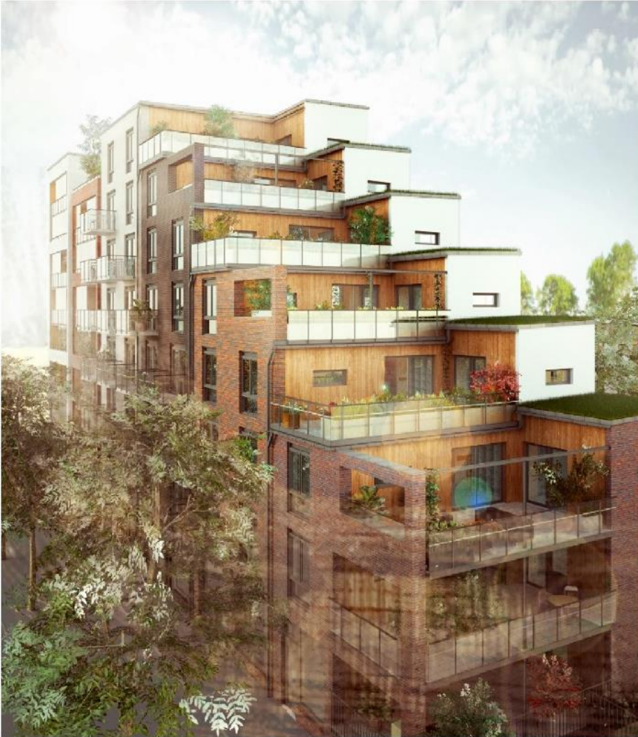
Trappningarna skapar möjlighet till södervända privata terrasser. Illustration: Ettelva arkitekter.

Kvarter B är ett så kallat superbloc där den arkitektoniska idén tar avstamp i hur bottenvåningen bildar ett podium med sammanhängande förskjutna volymer ovanpå som trappar upp sig mot norr. En viktig del i gestaltungsgreppet är hur byggnadens gatuplan är tänkt att fungera som en förlängning av det intilliggande torget. Gränsen mellan den publika ytan och kvarterets lokaler är justerbar efter årstid. Detta genom en serie vinterträdgårdar som skapar förutsättningar för en fickparks känsla som förlänger den varma årstiden och skapar olika rum som kan vara både ute och inne. De högre