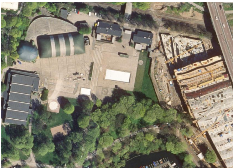
Bild 2 visar pågående uppförande av nya huvudbyggnaden. Till vänster syns tältöverbyggnaden av 50-metersbassängen.

Programhandlingsarbetet har bedrivits enligt fastighetskontorets nya process för stora projekt med flera förvaltningsövergripande arbetsgrupper.