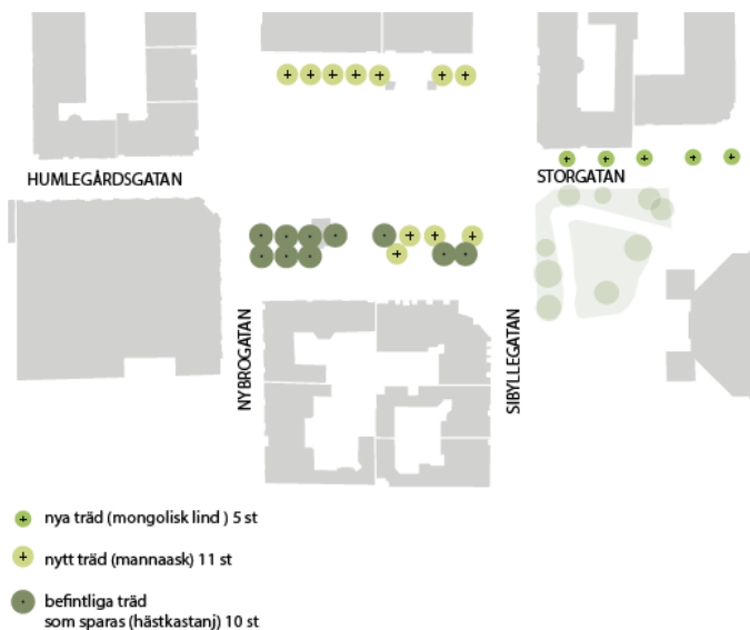
Bild 6. Illustration som visar nyplanterade respektive sparade träd.

Den tidigare trädraden i norr ersätts efter tätskiktsbytet med nya träd planterade i täta trädskar, förslagsvis manna-ask, som fungerar väl i stadsmiljö. De stora hästkastanjerna på södra sidan bevaras så långt som möjligt; dock behöver tre träd tas ner, p.g.a. skador samt för att möjliggöra infart för räddningsfordon och ge plats för ny belysning. Nedtagna träd ersätts med nya, se förslag i bild nedan.