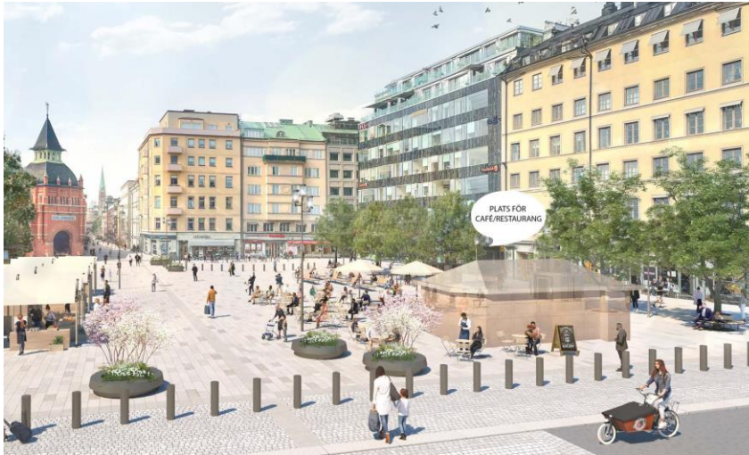
Bild 12. Bilden visar illustration av täta, höga pollare sett från Sibyllegatan