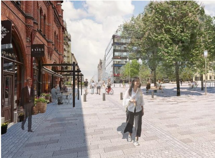
Bild 4. Visionsbild över föreslaget nytt torg, sett från södra Nybrogatan i riktning mot Saluhallen.

Storgatan stängs av helt för biltrafik på den korta sträckan mellan Sibyllegatan och Jungfrugatan och byggs om till cykelbana och gångbana med träd, bänkar och belysning.