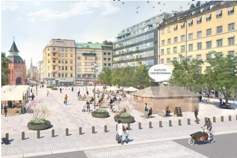
Bild 11. Vy över det nya torget med föreslagna trafikhinder mot Sibyllegatan

För att hindra genomfart av obehörig trafik på torget behöver pollare eller andra trafikhinder monteras. Östermalmstorg är utpekad som ett av stadens torg där folksamlingar och opinionsyttringar ska kunna förekomma. För att uppnå en hög säkerhet föreslås pollare runt vändplanen vid Nybrogatan, längs gränsen mellan torget och Sibyllegatan, framför Saluhallens fasad tvärs över Nybrogatan och som skydd för trafik läng norra fasaden. Pollarna utformas för att klara en påkörning med 7,2 ton i 48 km/h, vilket numera är standard i normal stadsmiljö vid nybyggnation. De utförs med pollarhölje av lackat stål, med synlig höjd ca 0,6 m, diameter ca 0,2 m och med nedgjuten grundläggning. Där skyddsbehovet är som störst placeras de med avståndet 1,2 meter medan ett avstånd upp till 1,7 meter medges där behovet är lägre.