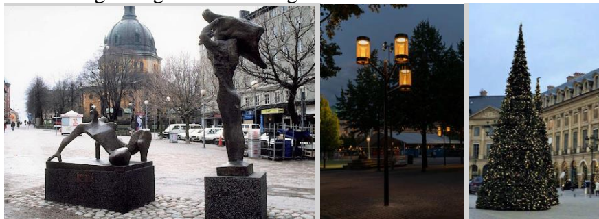
Bild 10. Bilden visar konstverket "Möte" samt exempel på ny belysning och en julgran