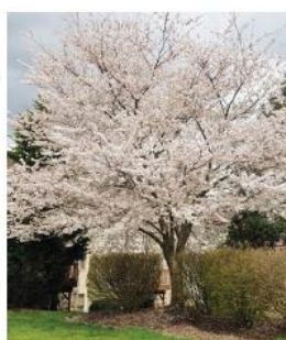
ETT VITROSA FLOR - TOKYOKÖRSBÄR