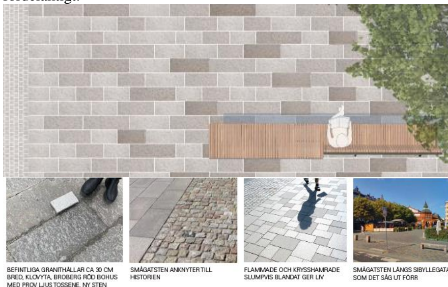
Bild 8. Bilden visar illustrationer över ny markbeläggning med olika typer av granithällar och smågatsten

Föreslaget golv innebär en förändring jämfört med det förslag som presenterades för inriktningsbeslut genom att det cirkulära mönstret har frångåtts. Kontoret har bedömt den befintliga markens lutning och konkava form som visuellt ogynnsam för cirkulärt mönster. Att lägga stenen i raka fallande längder bedöms även ekonomiskt mer fördelaktigt.