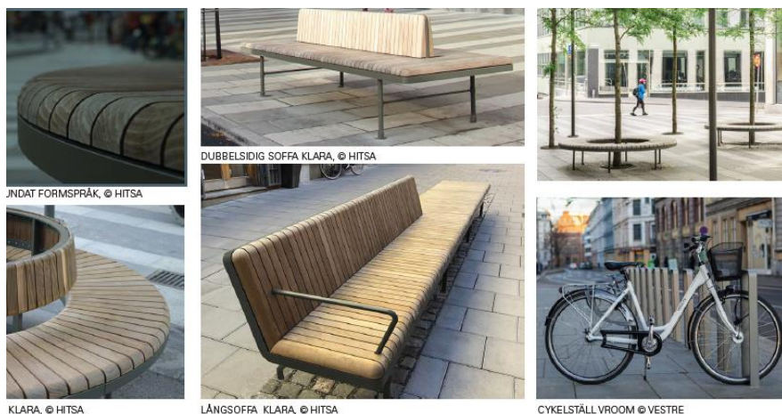
Bild 8. Bilden visar exempel på olika sittmöbler och cykelställ