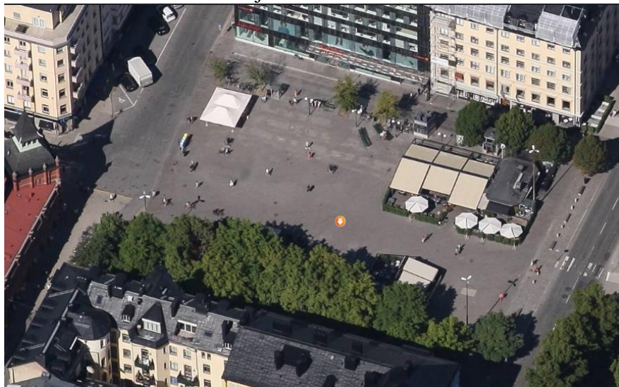
Bild 2. Flygbild över Östermalmstorg innan ombyggnaden av saluhallen. Tunnelbanans biljetthall ligger under övre (norra) halvan av torget.

i syfte att renovera eller byta det tätskikt som utgör tak för biljetthallen. Arbetena är beräknade att slutföras i början av december 2022.