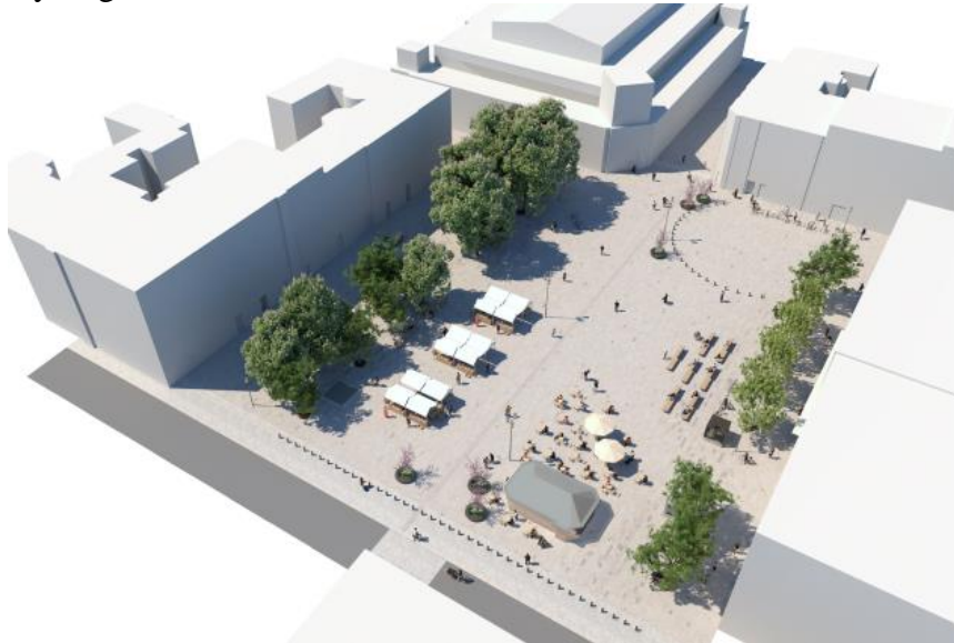
Bild 3. Flygbild över föreslaget nytt torg, sett från Sibyllegatan.

en angoringsficka som bl.a. kan användas av torghandeln. Längs torgets norra fasad, med in- och utfart från Sibyllegatan, tillåts endast behörig trafik till entréer och befintligt garage. Pollare samt blomsterurnor hindrar genomfartstrafik till Nybrogatan.