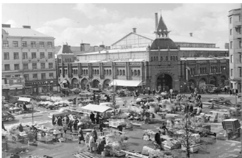
Bild 1. Bilden visar historisk torghandel på Östermalmstorg med utsikt mot Saluhallen.

Östermalmstorg är ett centralt och välbesökt torg mitt i centrala Stockholm med gamla anor och stort kulturhistoriskt värde. Torget har en lång tradition som salutorg med liv och rörelse, intensiv aktivitet och genomfartstrafik. Torget har under långa perioder varit byggarbetsplats, bl a under åren 1962-65 när tunnelbanan byggdes under torget, när teatern Folkan revs (2007-2008), när Saluhallen renoverades och torgytan uppläts för en tillfällig saluhallspaviljong (2015-20) och nu senast när trafikförvaltningen utför tätskiktsrenovering av biljetthallens takkonstruktion.