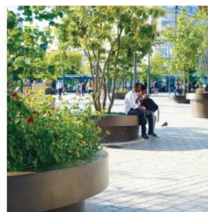
URNOR MED BLOMMOR OCH FLERSTAMMIGA SMÅTRÄD © Streetlife