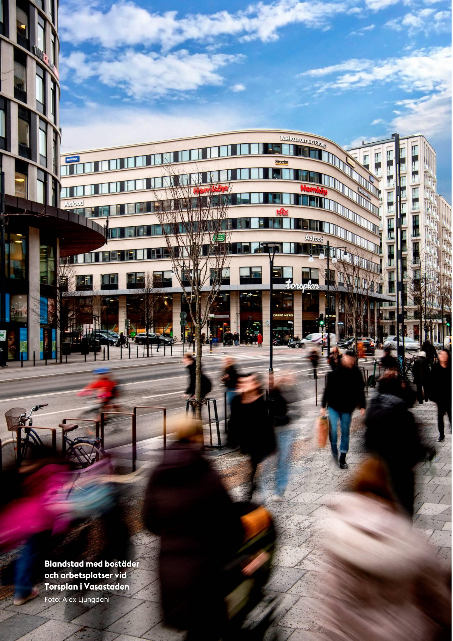
Blandstad med bostäder och arbetsplatser vid Torsplan i Vasastaden