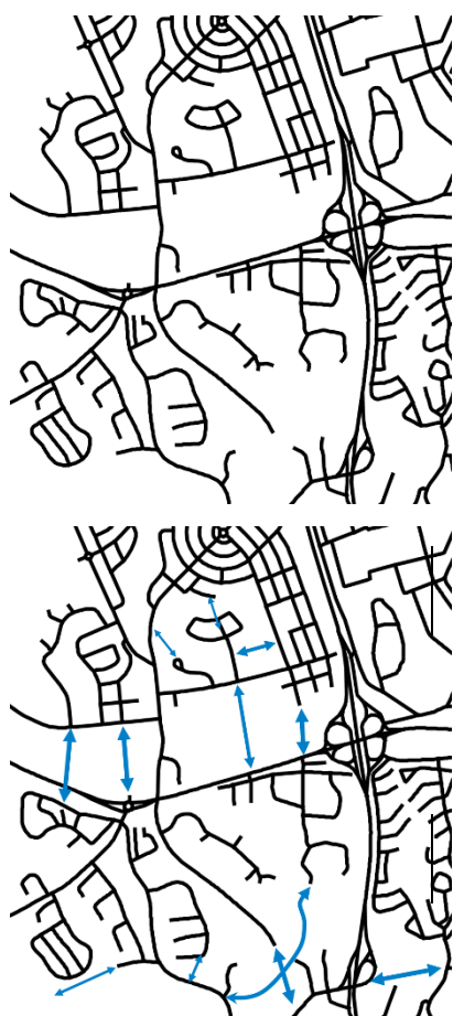
Figur 2. Principskiss över isolerade gatustrukturer och potentialen i att koppla samman med flera länkar.

Sammanställningen visar på en mångfald av tillgängliga verktyg för att stärka sambanden. De olika verktygen används i samtliga tolv strategiska samband, dock i varierande omfattning och med olika stor effekt. På en strukturell nivå föreslås stadsdelar knytas tätare varandra genom ny bebyggelse och stadsrum som stärker stråk och förändrar rörelsemönster.