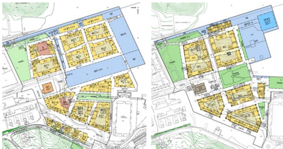
Figur 2. Detaljplan för Kolkajen. Till vänster samrådshandling från 2016. Till höger granskningshandling från 2023. Illustrerar ändring.

När det gäller delprojektet NDS Kolkajen-Ropsten har systemhandling tagits fram två gånger på grund av ändrad struktur på detaljplanen. Nedan visas grovt den förändring som skett mellan de bägge systemhandlingarna.