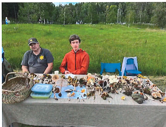
Svamputställning under bioblitzen

Tyresta nationalpark och naturreservat, liksom Stiftelsen Tyrestaskogen, firade under 2023 sitt 30-års jubiléum. Samtidigt fyller begreppet naturum har funnits i 50 år. Vi uppmärksammade detta genom att i samverkan med intresseorganisationer anordna en bioblitz med syftet att lyfta den biologiska mångfalden i Tyresta. Experter inom olika artgrupper ledde exkursioner med allmänheten och identifierade arter i nationalparken strax intill Tyresta by. På två timmar hittades 357 arter, varav 13 rödlistade. Det kan man kalla biologisk mångfald! Det fanns också tipspromenader, pyssel, möjlighet att prova att sitta i en traktor eller klyva ved med flera aktiviteter. Det blev en lyckad dag, med många deltagare, 2800 besök i Tyresta by, och 65 deltagare i de guidade exkursionerna, samt ett reportage i den lokala tidningen Mitt i Haninge .