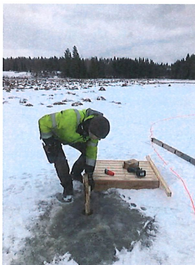
Montering av häckningsflottar i fågelsjön.

Pontoner för fågelhäckning har uppförts i fågelsjön i Tyresta by.