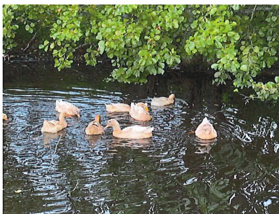
Svensk gul anka, en av våra lantraser

Under året köpte vi in 4 rödkullor, samtliga dräktiga, från Dalsland. En gotlandsbagge togs in för att få in nytt genetiskt material. Under året föddes 7 kalvar och 33 lamm.