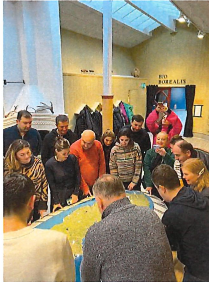
En utländsk myndighetsdelegation guidas på naturum nationalparkernas hus

Vi har också fokuserat på att kommunicera naturvård, även det ett flerårigt projekt, där vi 2023 arbetat med en kommunikationsplan för naturvårdsinsatser. Utöver det har utställningen om invasiva arter, vårt årliga slättergille, programaktivitet kring invasiva arter och våra naturvårdare närvaro på Tyrestadagen varit delar i vår kommunikation av naturvårdsinsatser.