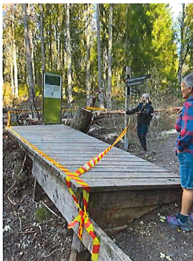
Bro vid Urskogsstigen, svårt skadad av träd som fallit.