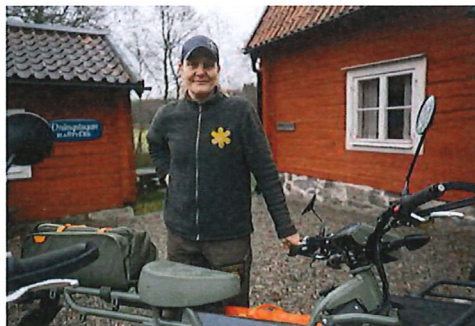
Naturvårdsvakt med elmotorcykel

Med tanke på det stora antalet besök i Tyrestaområdet, lättillgängligheten och det tätortsnära läget, kan antalet olyckor, brott och andra incidenter trots allt betraktas som lågt.