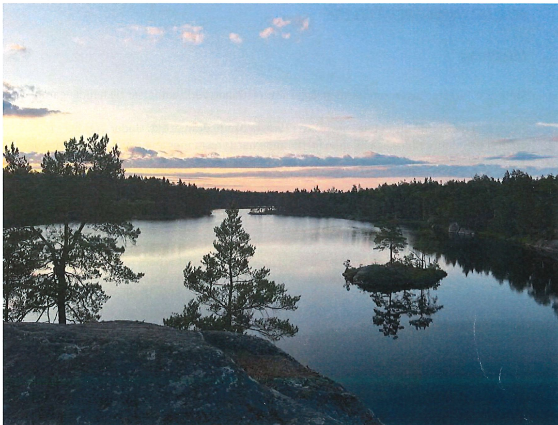
Utsikt över södra Årsjön kl. 21:30 midsommardagen 2023.

Om inte annat särskilt anges, redovisas alla belopp i hela kronor (sek).