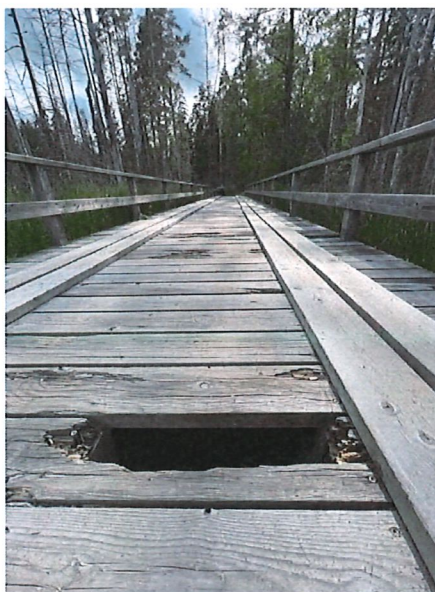
Den skadade bron vid Bylslätt är utdömd för biltrafik.