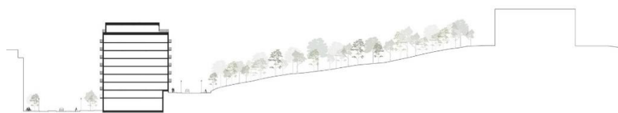
Sektion genom Västra Terrasskvarteret och Hjorthagsberget (t h) med äldre bebyggelse. (Illustration: CF Møller Architects)

Stads- och landskapsbilden bedöms påverkas positivt genom att platsen får ett mer ordnat och gestaltat uttryck i gränsen mot Hjorthagsberget. De solitära huskropparna skapar kontakt mellan berget och den kommande bebyggelsen i Kolkajen samtidigt som möjligheten till utblickar över landskapet och vattnet bibehålls. Nivåskillnaden på platsen, som idag tas upp genom en stödmur av betong, kläs in av föreslagen bebyggelse och park.