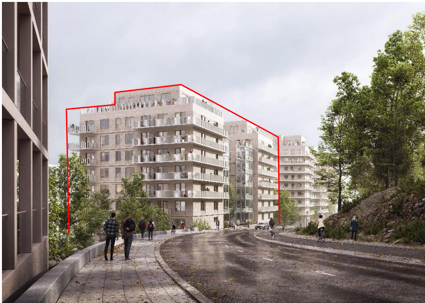
Vy från Gasverksvägen österut. Detaljplanen omfattar de två byggnader som markerats med rött. Närmast till vänster en av de planerade nya byggnaderna inom Gasverket Östra. Bild: CF Möller Architects

Terrasskvarteren utgörs av en grupp byggnader (varav detta tjänsteutlåtande behandlar den västra delen med de två byggnaderna närmast gasverket) på en smal markremsa med stor nivåskillnad mellan Bobergsgatan och Gasverksvägen. De bildar en övergång mellan den kommande bebyggelsen på Kolkajen och den äldre bebyggelsen och grönskan på Hjorthagsberget. Med 10 våningar, som ansluter till planerade byggnader inom gasverket, kommer byggnaderna att utgöra en del av en fond till Kolkajen. Likt övriga byggnader längs Hjorthagsbergets fot skapar de en öppen struktur som låter bergets grönska vara synlig i stadslandskapet. Längs Gasverksvägen skapas tillsammans med ny bebyggelse i Gasverket Östra en serie av solitära huskroppar som landar i mer samlade volymer på den lägre nivån.