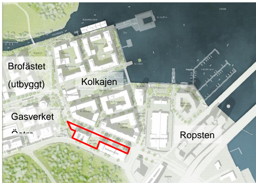
Planområdets läge i förhållande till omgivande utbyggda och planerade områden.