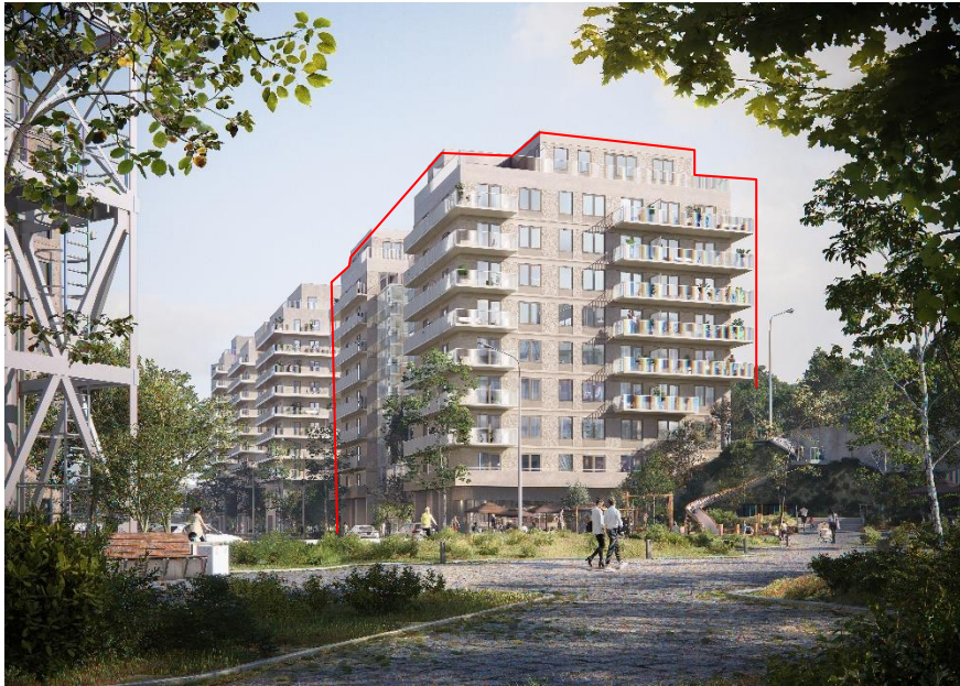
Vy från Gasverksparken österut. Detaljplanen omfattar de två byggnader som markerats med rött. Närmast till vänster det så kallade flamtornet, en bevarad konstruktion från gasproduktionen. Bild: CF Möller Architects

Ett horisontellt motiv av långsgående balkonger ger boendekvaliteter med rymliga uteplatser samtidigt som ljudmiljön i bostäderna förbättras. Översta våningen i varje hus är indragen. Byggnaderna binds samman längs Bobergsgatan av en tydlig sockel med högre våningshöjd, som med publika lokaler och entréer skapar kontakt med gatan. På ömse sidor om kvarteret finns parkstråk med trappor som binder samman de olika nivåerna.