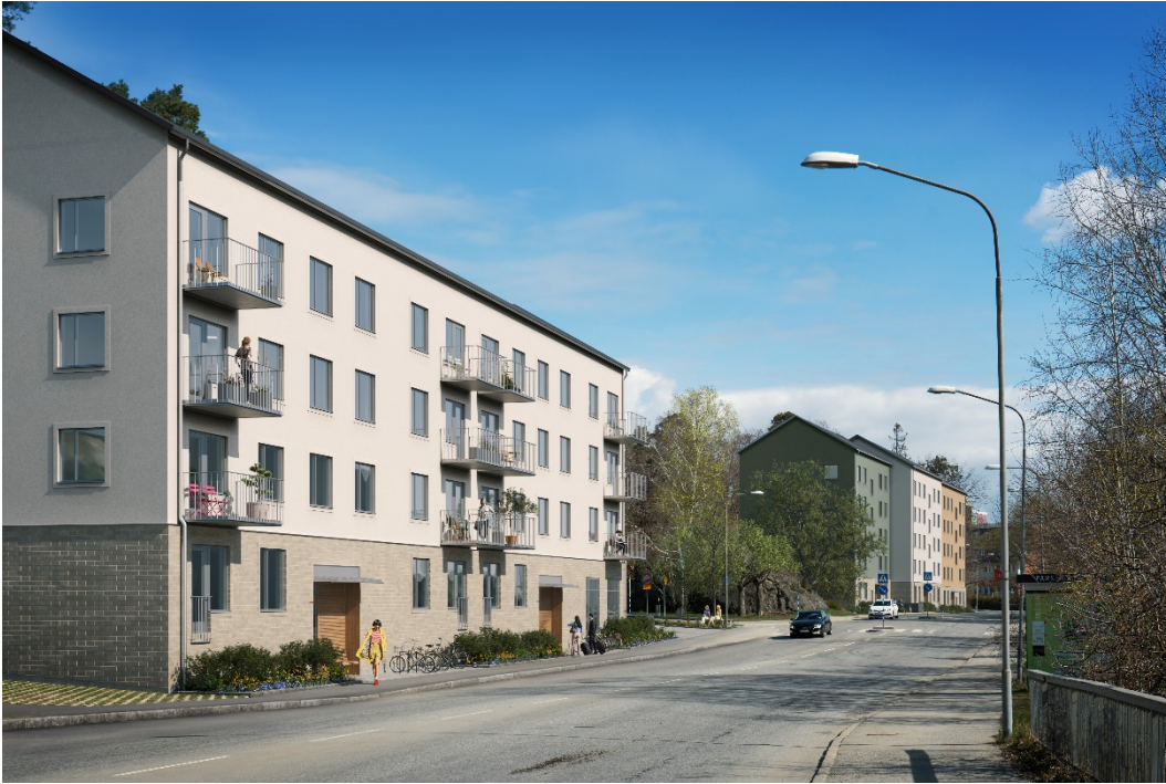
Visionsbild Karlsö 5 i förgrunden och Skällö 1 bakgrunden med sina olikfärgade fasader.