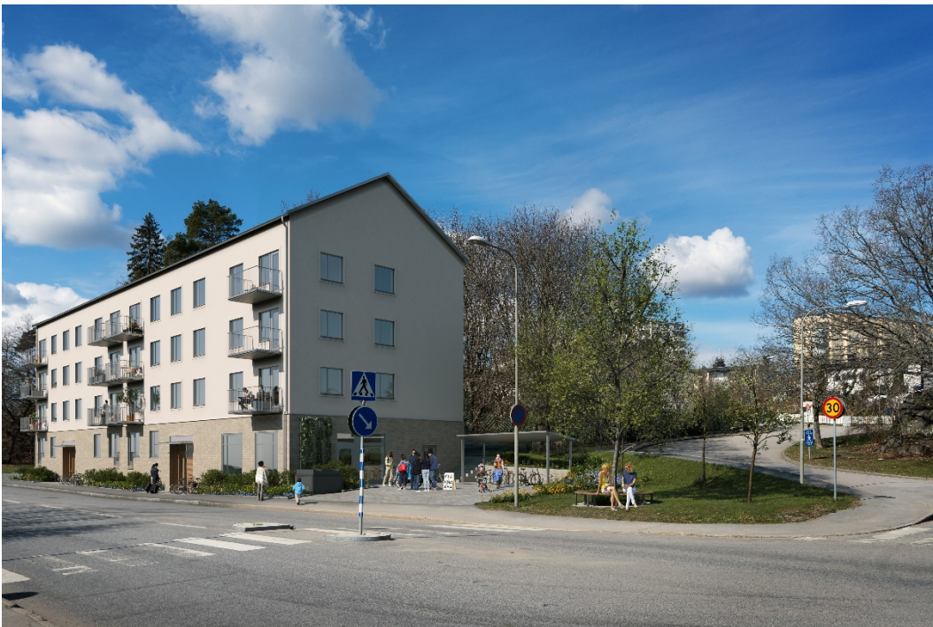
Visionsbild Karlsö 5.