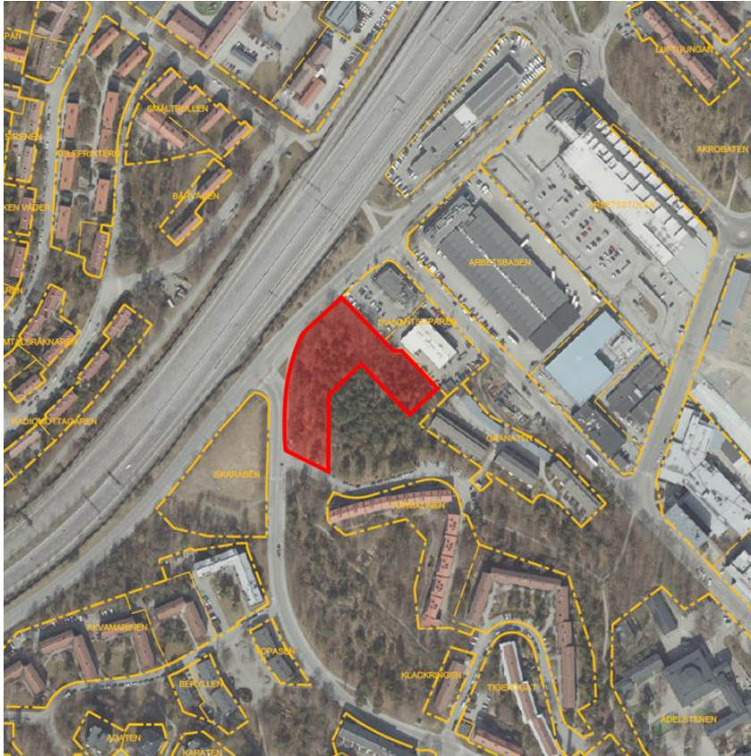
Figur 3. Ortofoto med fastighetsgränser, med området som föreslås markanvisas markerat i rött.

Markanvisningen gäller nybyggnad av cirka 150-160 lägenheter i flerbostadshus. Kontoret föreslår att lägenheterna ska upplåtas med hyresrätt.