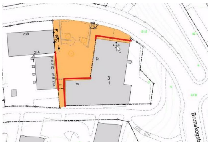
Brunskogsbacken i Farsta Strand.

Den tredje justeringen som gjorts är en utökning av alkoholförbudet kring Farsta centrum för att även omfatta grönområdet ovanför Larsbodavägen i höjd med tunnelbanan. Detta mot bakgrund av att det under en längre tid har funnits en otrygghetsproblematik med nedskräpning i samband med alkoholmissbruk.