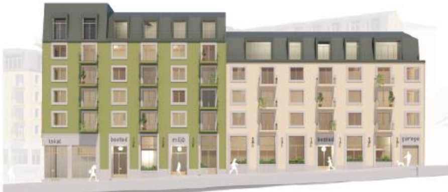
Exempel på sektionvis färgsättning. Illustration DinellJohansson och Belatchew Arkitekter.