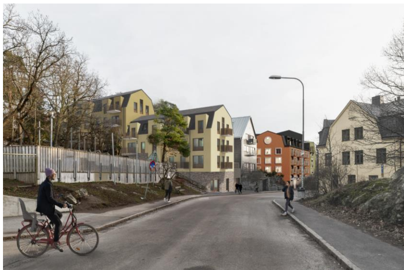
Erik Segersälls väg sedd mot öster. Illustration DinellJohansson och Belatchew Arkitekter.