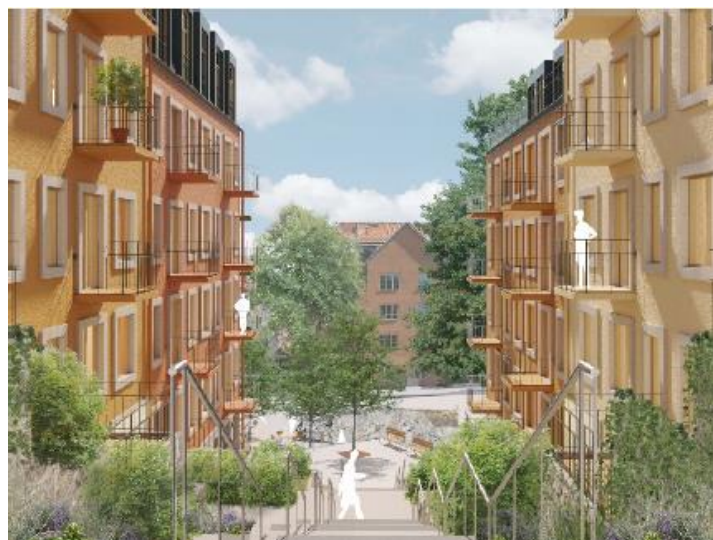
Trappstråket, vy ned mot torget. Illustration DinellJohansson och Belatchew Arkitekter.