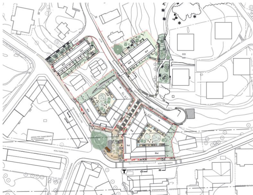
Illustration över föreslagen bebyggelse och allmän platsmark Illustration DinellJohansson och Belatchew Arkitekter.

och Norra delen som innehåller var sitt flerbostadshus med 20 till 30 bostäder. Centrala delen omfattar även lokaler för centrumändamål om cirka 750 kvm BTA. I samtliga delområden inryms parkeringsplatser i garage under respektive byggnad.