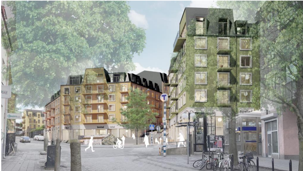
Vy över det planerade torget mot öster. Illustration DinellJohansson och Belatchew Arkitekter.