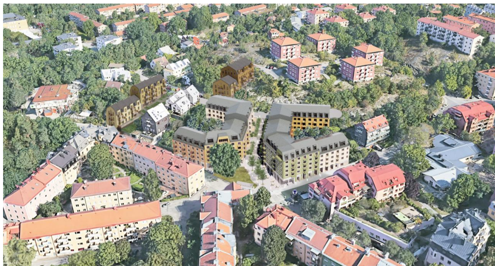
Hela planförslaget sett snett ovanifrån mot norr. Illustration DinellJohansson och Belatchew Arkitekter.