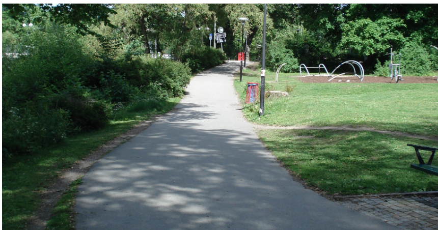
Figur 4. Bild på gc-banan genom parken, riktning österut.

Pålsundsbacken är en av kopplingarna mellan Söder Mälarstrand och Långholmsgatan, vilka båda är stora cykelstråk (Söder Mälarstrand ca 2 900 cyklar/dygn och Västerbron ca 9 600 cyklar/dygn). Körbanan är ca 11 meter bred, med ett körfält i vardera riktningen. På båda sidor finns gångbanor. Trafikflödet är ca 12 500 fordon/dygn. Gatan trafikeras inte av reguljär busstrafik. Ingen parkering finns längs gatan, men det finns en verksamhet i höjd med mitten av backen med in-/utfart mot Pålsundsbacken.