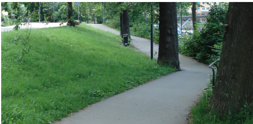
Figur 7. Bild på gc-banan längsmed vattnet, riktning västerut.