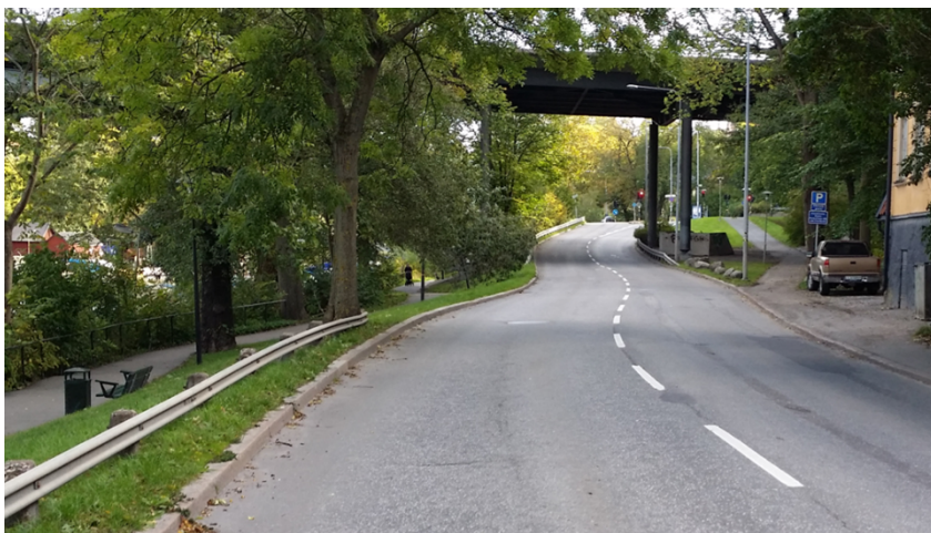
Figur 3. Bild på körbanan under Västerbron, riktning österut.

Vissa cyklister väljer att istället cykla i körbanan i blandtrafik.