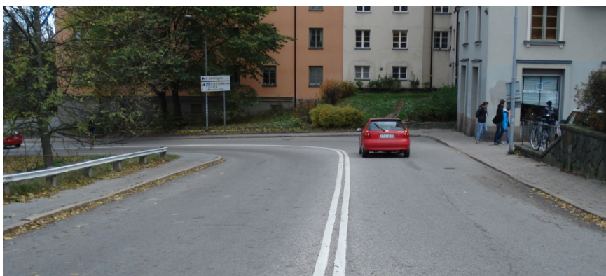
Figur 5. Bild på Pålsundsbacken sett från Långholmsgatan.

Pålsundsbacken är en av kopplingarna mellan Söder Mälarstrand och Långholmsgatan, vilka båda är stora cykelstråk (Söder Mälarstrand ca 2 900 cyklar/dygn och Västerbron ca 9 600 cyklar/dygn). Körbanan är ca 11 meter bred, med ett körfält i vardera riktningen. På båda sidor finns gångbanor. Trafikflödet är ca 12 500 fordon/dygn. Gatan trafikeras inte av reguljär busstrafik. Ingen parkering finns längs gatan, men det finns en verksamhet i höjd med mitten av backen med in-/utfart mot Pålsundsbacken.