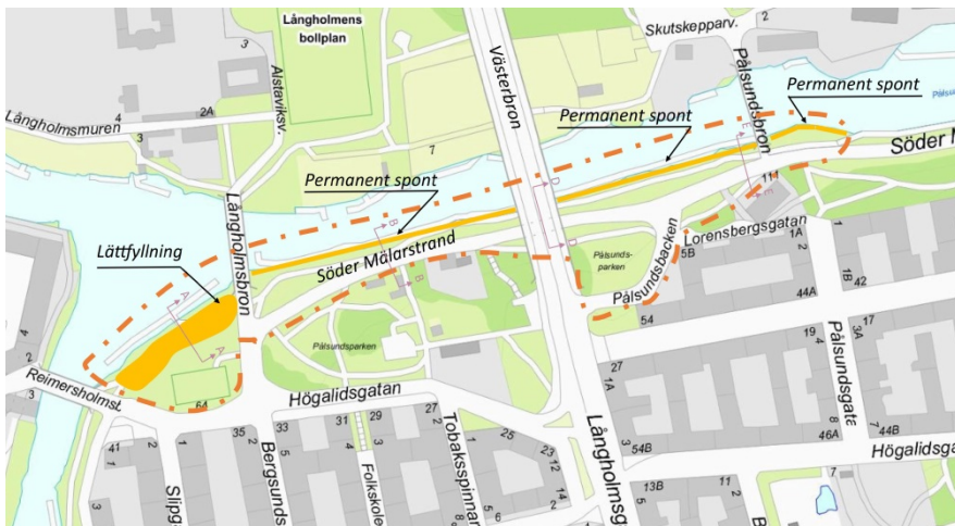
Figur 1. Projektets utbredningsområde