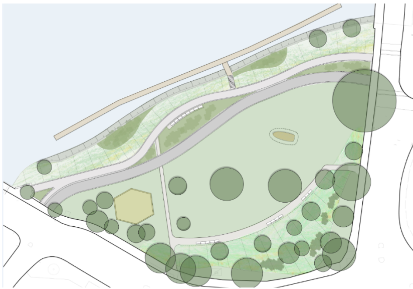
Figur 9. Illustration av Pålundssparken

Ny gångbana läggs i ungefär samma läge som nuvarande gång- och cykelbana. Den nya cykelbanan placeras söder om gångbanan. De åtskiljs genom en visuell och taktil avgränsning med storgatsten. På två ställen längs sträckan vidgas avståndet mellan gång- respektive cykelbana.