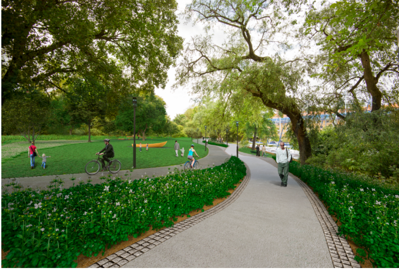
Figur 10. Illustration av gång- och cykelbana genom Pålundssparken

Mellan Långholmsbron och Pålundsbron måste befintlig vegetation tas bort längs de sträckor där spont slås. Nuvarande strandlinje ersätts till stora delar med permanent spont med en krönbalk av betong som utgör ny kaj sida. Nedtagna träd ersätts med nyplantering i samma omfattning, men så att framtida utblickar mot vattnet blir något större än idag.