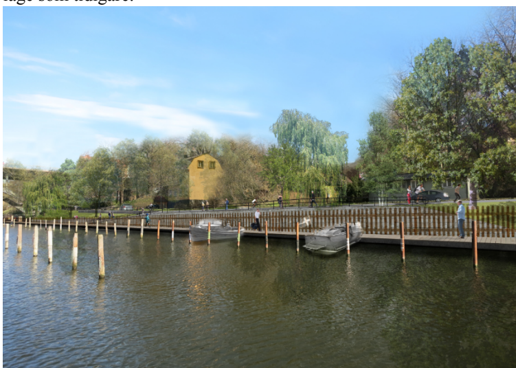
Figur 12. Illustration av vyn från vattnet mot Söder Mälarstrand

Med den befintliga karaktären i åtanke kommer entréernas utformning till bryggorna att skiljas åt något för att skapa variation längs stråket och för att entréerna ska få sin egen identitet. Förtöjningspålarna ute i sundet återställs i samma läge som tidigare.