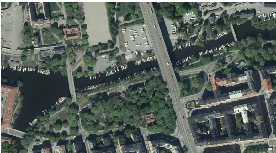
Figur 11. Flygfoto över den berörda delen av Söder Mälarstrand.

Nuvarande båtbyggor i Pålsundet rivs i samband med förstärkningsarbetena och ersätts med nya byggor i liknande utförande. Nuvarande sick-sack-linje rätas ut på grund av spontlinjen. En vattenspegel mellan mark och brygga skapas vilket stärker upplevelsen av närhet till sundet från gångvägen. Höjden på bryggorna döljer krönbalken från vattensidan. Spänger i trä kopplar bryggorna till gångvägen.