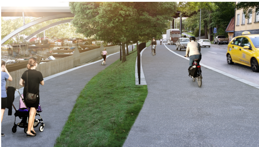
Figur 8. Illustration av ny gång- och cykelbana ovan spont

Ovanpå sponten utförs en krönbalk i betong vilket är ett nytt visuellt inslag vid Pålsundet. Dessutom tillkommer ett par stödmurar längs sträckan mellan Långholmsbron och Västerbron. Från sjösidan kommer krönbalken och murarna att till stor del döljas av båtclubbens nya bryggor och trähägnader.