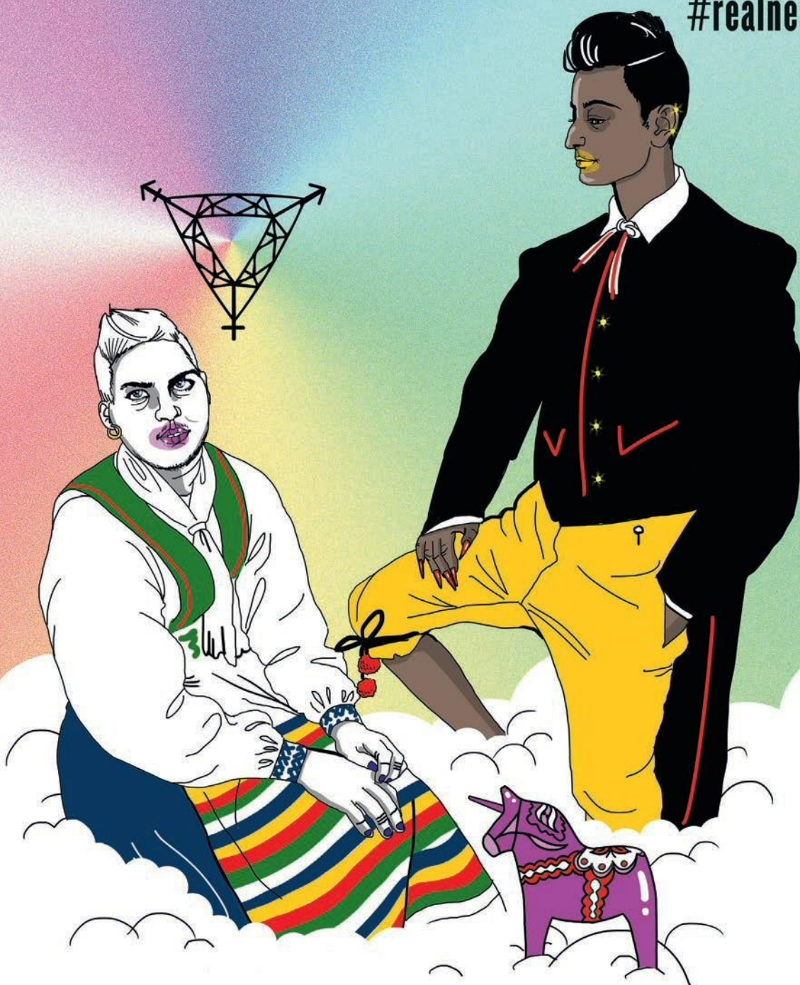
Illustration: C Käberg