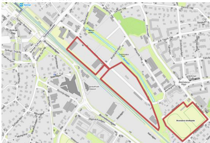
Figur 1 Området ligger i västra Stockholm i Bromsten nära Spånga station. Bilden visar den del (etapp 2) som omfattas av detaljplanen för kvarteren Gustav och Gunhild, tillika det föreslagna genomförandebeslutet.

Bromstens industriområde i Spånga utgörs av förhållandevis lågt utnyttjad industrimark med i huvudsak enklare bebyggelse och upplag. Staden äger drygt 20 % av kvartersmarken medan huvuddelen av industrimarken ägs av ett antal privata fastighetsägare. Det har länge funnits lokala önskemål om att omvandla industriområdet till ett nytt bostadsområde, då området upplevs som ödsligt och otruggt. I stadens översiktsplan anges att Spånga ska utvecklas till en attraktiv tyngdpunkt i ytterstaden. Förtätningspotentialen finns i huvudsak inom Bromstens industriområde. Mellan åren 2006 och 2008 togs ett detaljplaneprogram fram för att utreda områdets förutsättningar för bostäder och arbetsplatser vilket har resulterat i en detaljplan för kvarteret Tora mfl (etapp 1) samt ytterligare en detaljplan för kvarteren Gustav och Gunhild (etapp 2). Området, som i framtidsvisionen kallas Bromstensstaden, planeras innehålla bostäder med kommersiella lokaler i bottenvåning, förskolor, en skola, en ny park och en omdanad Bällsta å som är en central resurs för området.