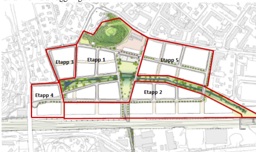
Figur 2. Bilden visar hur bostadsutvecklingen av Bromstensstaden skulle kunna ske. Etapp 3-5 kan delas upp i fler etapper och i en annan följd.

För de delar som exploateras på privat mark i Bromstensstaden kommer ett exploateringsbidrag att erfordras för att i viss mån kompensera för stadens utbyggnad av allmänna anläggningar.