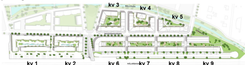
Illustrationsplan över de nio planerade kvarteren.

Planen omfattar nio stadskvarter längs med huvudgatan Skogängsvägen med ca 1000 lägenheter, lokaler i bottenvåningarna och åtta förskoleavdelningar. De sydvästra kvarteren avgränsas av Mälarsevägen och de nordöstra kvarteren av Spångaån.