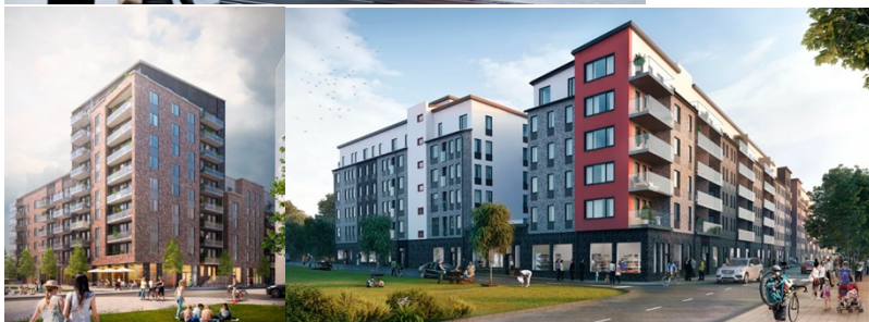
Uppe: kv 6-9, Brunnberg och Forshed. Nere tv: kv 1-2, Lindberg och Stenberg. Nere th: kv 3-5, Larsson arkitekter.

Planen möjliggör även skolanvändning för en F-9 skola med 900 elever, en ny idrottshall och två nya konstgräsplaner, varav en 11-spels- och en 7-spelsplan, på Bromstens IP.