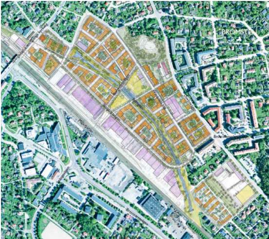
Strukturplanen för Bromstensstaden från 2007 med reviderat förslag för Bromstens IP från 2008.

Stadsbyggnadsnämnden uppdrog den 26 mars 2015 åt kontoret att påbörja planarbete i enlighet med kontorets tjänsteutlåtande.