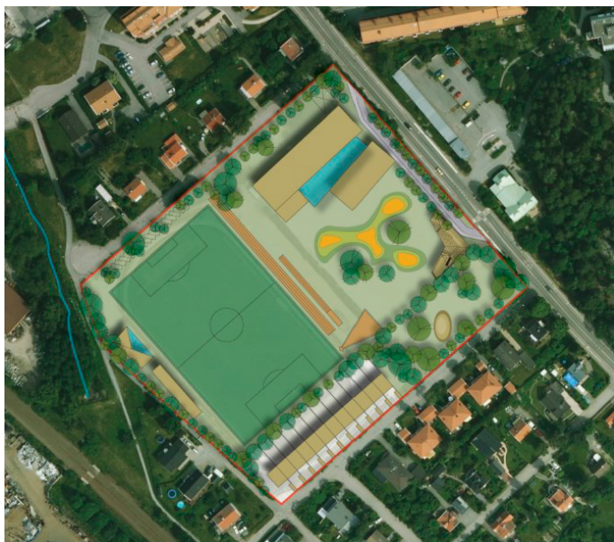
Strukturplanen för Bromstensstaden från 2007 med reviderat förslag för Bromstens IP från 2008.

Stadsbyggnadsnämnden uppdrog den 26 mars 2015 åt kontoret att påbörja planarbete i enlighet med kontorets tjänsteutlåtande.