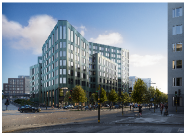
Kvarter 7 och 8: Till vänster, idrottshallen sett från idrottstorget. Till höger, kvarter 8 sett från korsningen Lindhagens- och Kjellgrensgata.