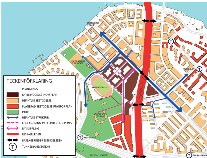
Planområdets struktur och relation till området i övrigt

Ambitionen är att området ska bli en modern stadsdel med innerstadens starka attraktionskraft och stadskvalitéer. Den nya bebyggelsen planeras med stenstadens traditionella skala och täthet samt en blandad användning av bostäder, arbetsplatser och service med levande bottenvåningar för att bidra till en levande stad. Att planområdet ligger i direkt anslutning till Essingeleden ställer särskilda krav på att bebyggelsen utmed leden utformas för att klara krav med anledning av buller och risker samt för att fungera som skyddande skärm för bakomliggande stadsmiljö.