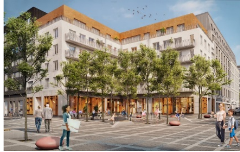
Kvarter 1: Till vänster, vy från korsningen Elersvägen/Nordenflychtsvägen. Till höger, vy från kvarterstorget .