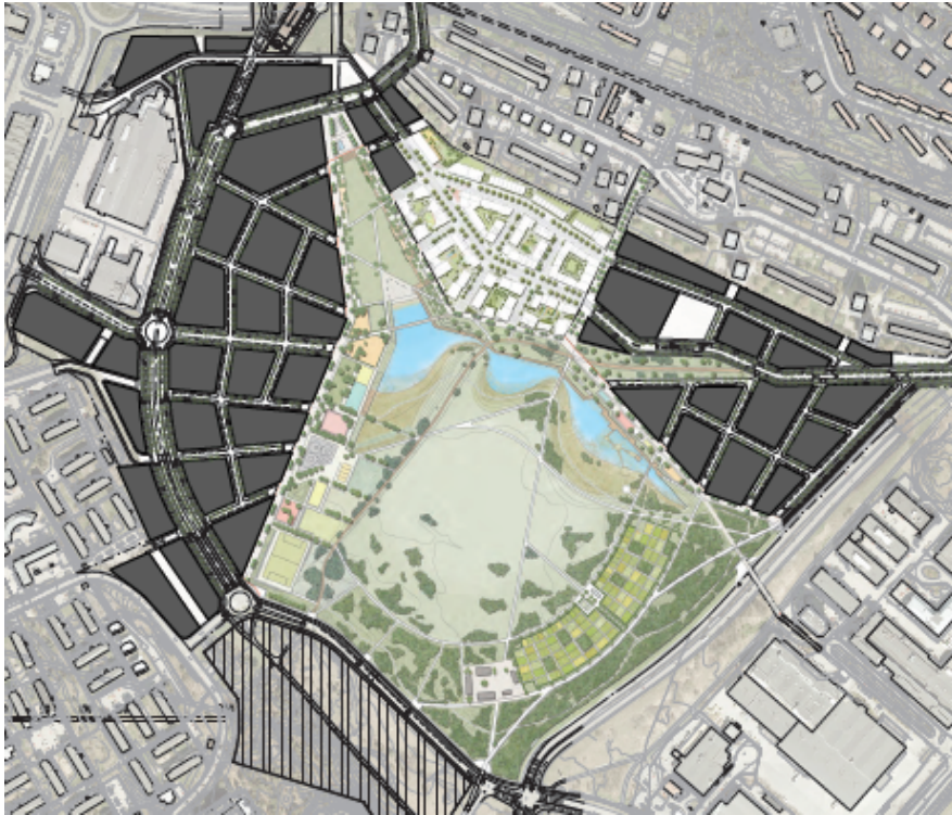
Årstafältet park i framtiden

Parken kommer att färdigställas i olika etapper. Den sista etappen beräknas bli klar cirka 2031.