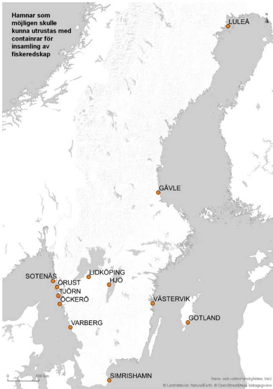
Figur 5 Föreslagen geografisk spridning av fiskehamnar för utsättning av containrar för insamling av yrkesfiskeredskap.

I det förslag som HaV lägger, förordning för fiskeredskap som innehåller plast, finns det inga hinder för insjöfiske eller vattenbruk att lämna in till ÅVC. Stora redskap som till exempel en trål kan däremot inte lämnas in på ÅVC.