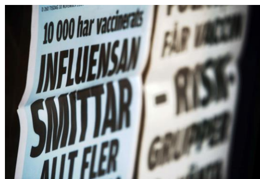
Bilden: Löpsedlar från år 2009

Detta antagande stärks av en snabb genomgång av gjorda studier av effekterna av tidigare pandemier. Effekterna på kort sikt har varit stora men små redan på medellång sikt. En studie av effekterna av Svininfluensan pekar på kraftigt ökade vårdkostnader och ett relativt stort produktionsbortfall under pandemin på grund av sjukfrånvaro. Den samhällsekonomiska konsekvensen av sjukfrånvaron bedöms dock inte ha varit större för Svininfluensan än under en vanlig säsongsinfluensa. 5 Människors beteenden förändrades inte heller märkbart efter pandemin.