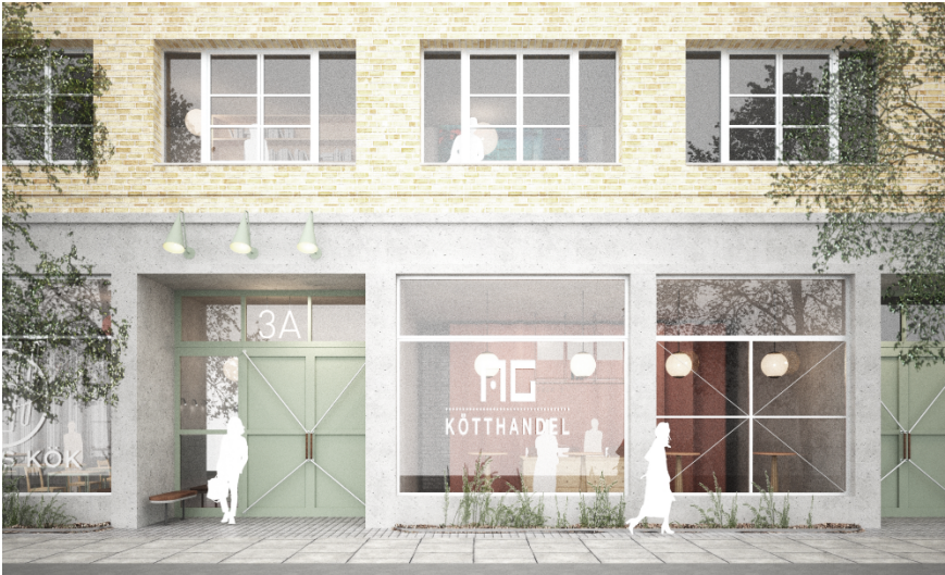
Exempel på markerad bottenvåning inom kvarter R. Bild: DinellJohansson.