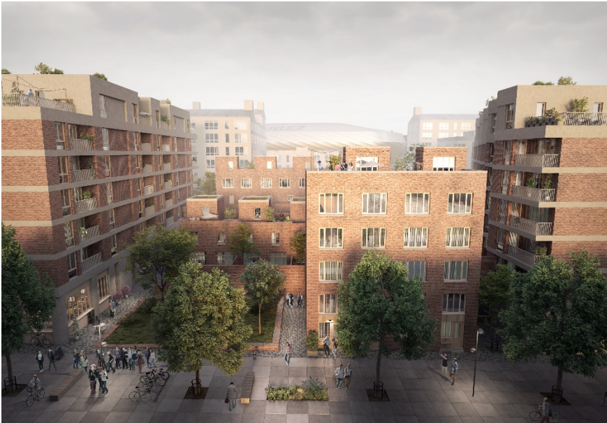
Exempel på uppbruten kvartersutformning inom kvarter Q. Till vänster i bild syns en fickpark. Bild: Jägnefält Milton.

Kvarteren i aktuell detaljplan är uppbrutna för att uppnå goda dagsljusförhållanden både i kvarteret och i gaturummet. Huvudsakligen har högre byggnader placerats i änden av de långsmala kvarteren. På det viset ges även smala gaturum i nord-sydlig riktning goda ljusförhållanden.