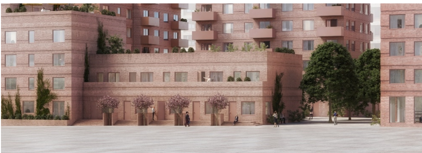
Exempel på stadsradhus i möte med gatan i kvarter L.

Kvarteren i aktuell detaljplan är uppbrutna för att uppnå goda dagsljusförhållanden både i kvarteret och i gaturummet. Huvudsakligen har högre byggnader placerats i änden av de långsmala kvarteren. På det viset ges även smala gaturum i nord-sydlig riktning goda ljusförhållanden.