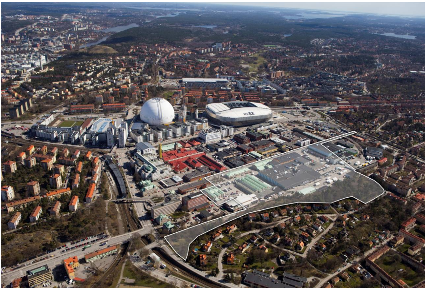
Karta som visar planområdets ungefärliga avgränsning.

Planområdet omfattar cirka tio hektar och ligger i stadsdelen Johanneshov. Det avgränsas i öster av Hallvägen, i norr av intilliggande kvarter och Palmfeltsvägen, i söder av den planerade Diagonalen (förbindelseväg i ost-västlig riktning) och i väster av intilliggande bostadsområde i Enskede gård.