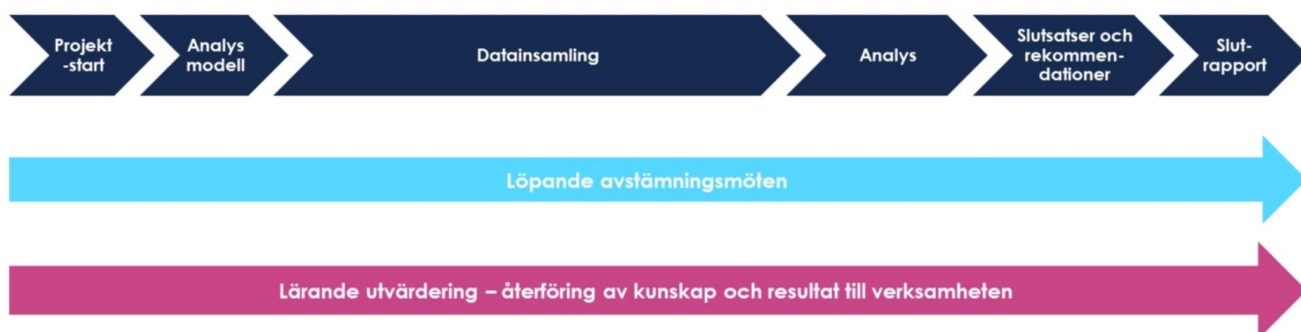
Figur 3: Översiktlig projektplanering