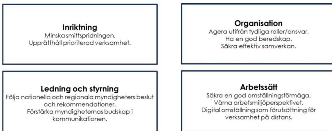
Figur 2: Nedbruten analysmodell utifrån stadens inriktningar under pandemin.

För att kunna besvara de frågeställningar som initialt sattes i utvärderingsarbetet har respektive dimension i analysmodellen förtydligats med hur vi uppfattat stadens inriktningar/viktiga perspektiv under krisen, se figur 2 nedan. Detta för att på ett naturligt sätt koppla den inriktning som gällt för staden till de analysområden som krävs för en effektiv verksamhet. Inriktningarna har återfunnits i ordinarie styrdokument, i säkerhetsprogrammet samt i den kommunikation som gått ut från CKL och stadsledningskontoret.