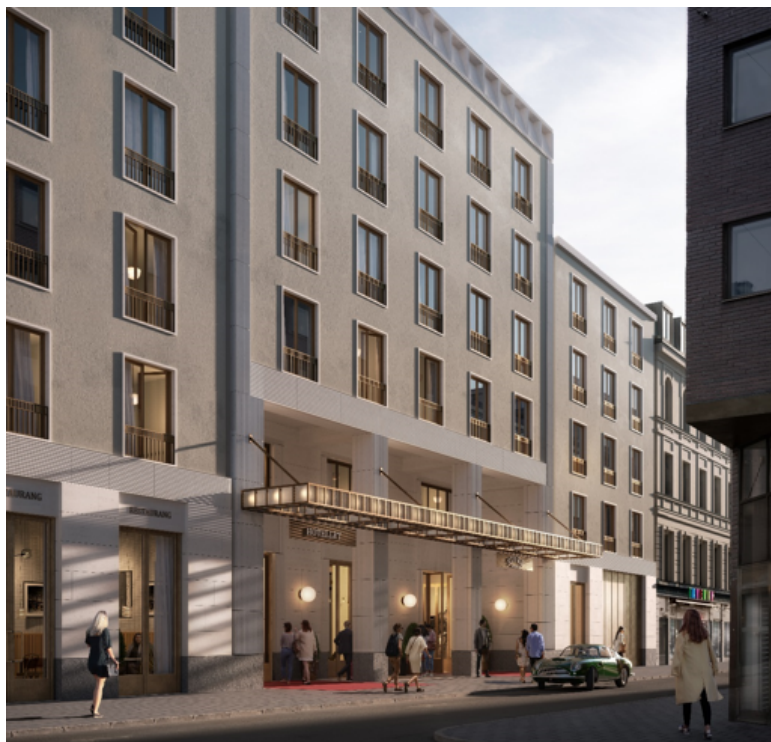
Perspektiv som visar föreslaget hotell samt entré till gallerian från Humlegårdsgatan.

Ett bevarande av byggnaden på Humlegårdsgatan 17 innebär å andra sidan att den fortsatt kan representera den postmodernistiska epoken i kvarteret. Interiört bevaras bland annat ljusgården i anslutning till Sturebadet, även den utpekad som ett tidstypiskt exempel.