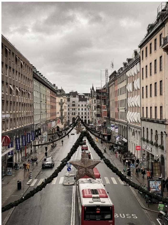
Perspektiv från Regeringsgatans bro mot Stureplan med Bångska palatsets rekonstruerade fasad i fonden på Kungsgatan. Byggnad på Humlegårdsgatan 17 bevarad samt den högsta byggrätten på Freys Hyrverk sänkt.