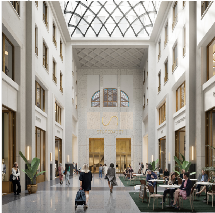
I den nya gallerian är högresta dagsljusbelysta rum kompositionens stomme. Perspektiv från över entrérummet från Humlegårdsgatan, med Sturebadet i fonden.

Ett bevarande av byggnaden på Humlegårdsgatan 17 innebär begränsade möjligheter till ombyggnad och ändrad användning. Det är inte heller möjligt att skapa en entré med en tydlig och offentlig karaktär mot Humlegårdsgatan. Kvarterets koppling till den omkringliggande staden försvagas därmed.