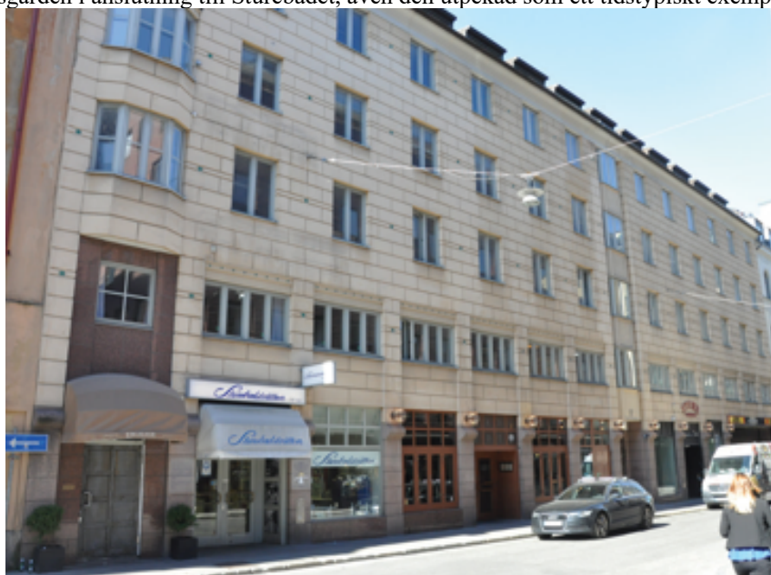
Befintlig byggnad på Humlegårdsgatan 17 med postmodernistisk fasad. Föreslaget andrahandsyrkande och dess innebörd

Ett bevarande av byggnaden på Humlegårdsgatan 17 innebär å andra sidan att den fortsatt kan representera den postmodernistiska epoken i kvarteret. Interiört bevaras bland annat ljusgården i anslutning till Sturebadet, även den utpekad som ett tidstypiskt exempel.