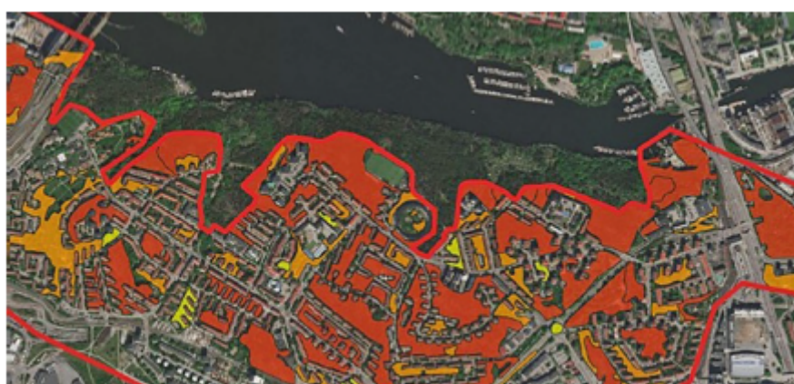
Karta 2: Utsnitt ur karta med bedömning av naturvärden i Årsta. Endast ytor utanför befintligt naturreservat har ingått i inventering och bedömning.

En naturmiljöutredning för Årsta har tagits fram som visar att alla de ytor som ingick i reservatsförslaget 2014 men som inte ingår i det nuvarande reservatet har högt värde.