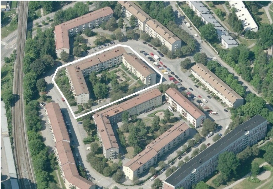
Vy från söder. Planområdet markerat med vit linje.