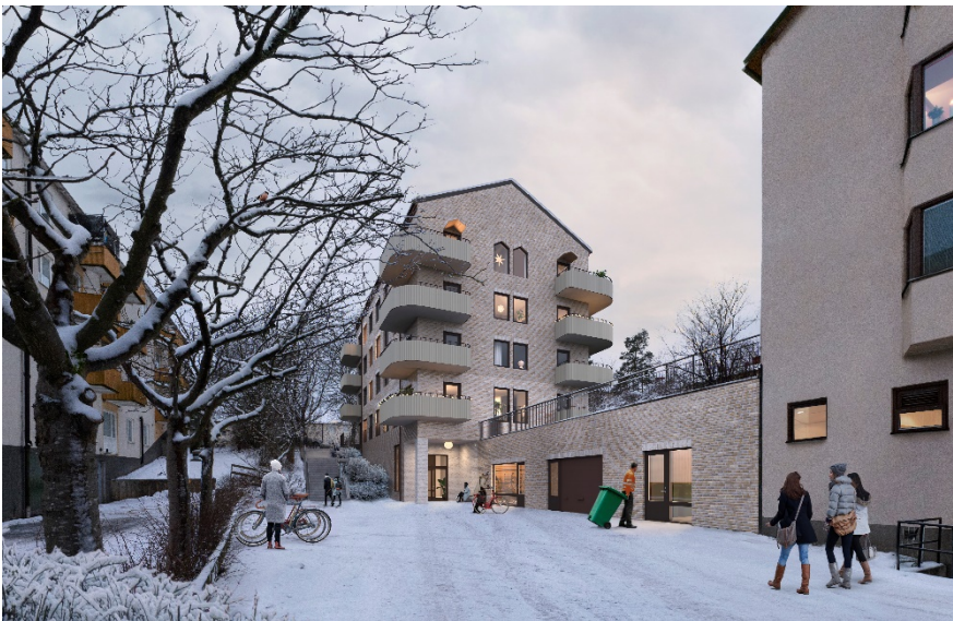
Planförslagets nya gårdshus sett från den nedre entrénivån mot öster med planerad ny trappkoppling utmed byggnadens fasad.