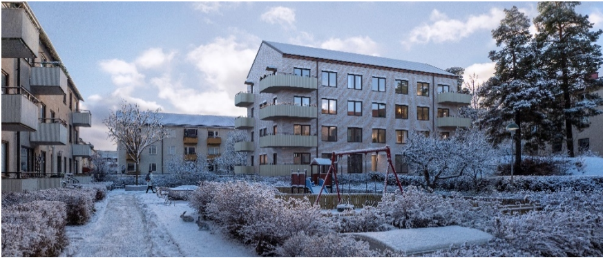
Planförslagets nya gårdshus sett från befintlig gård i norr. (Bild: Vardag arkitekter)