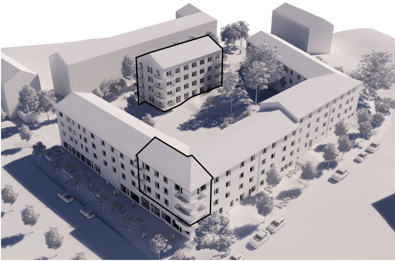
Illustration som visar befintligt kvarter samt föreslagen ny bebyggelse markerad med svart linje för gårdshuset och tillbyggnaden i kvarterets norra hörn. (Bild: Vardag arkitekter)