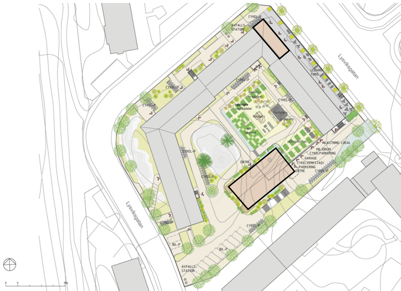
Situationsplan som redovisar den nya gårdsmiljön och placeringen av det nya gårdshuset i suterräng mellan gårdsnivån och garageentréns nivå, samt tillbyggnaden i kvarterets norra hörn mot Lysviksgatan. (Bild: Vardag arkitekter)

Planförslaget innebär att cirka 20 nya bostäder skapas genom nybyggnation av ett gårdshus i fyra våningar och en tillbyggnad i det norra hörnet av kvartersbebyggelsen mot Lysviksgatan. Bostäderna avses upplåtas med hyresrätt. Föreslagen gestaltning är en lågmäld samtida tolkning av den befintliga bebyggelsens kvaliteter och särdrag.