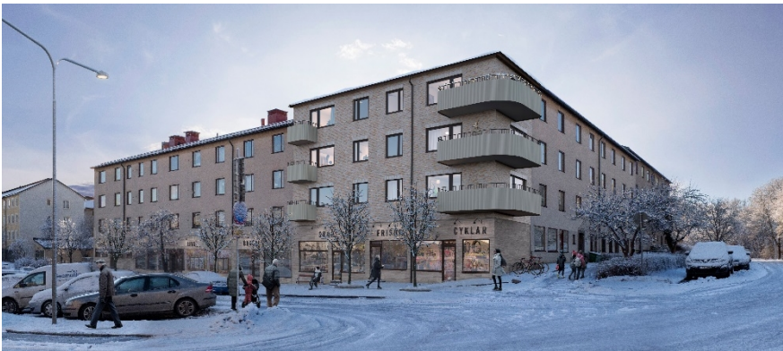
Planförslagets tillbyggnad i befintligt kvarters hörnindrag mot Lysviksgatan i norr. (Bild: Vardag arkitekter)

Gårdshuset placeras tvärställt med förskjutning mot befintlig huslänga mot Lysviksgatan i öster för att ansluta till liknande planmönster i området, där tvärställda förskjutna volymer är ett återkommande tema. Placeringen har också gjorts för att dels spara så mycket som möjligt av den befintliga gården med fina ljusförhållanden och natur, och dels anpassa placeringen till det befintliga garagets infart och stomme. Avståndet till angränsande byggnader har reglerats för att minimera skuggpåverkan och insynen från befintliga bostäder.