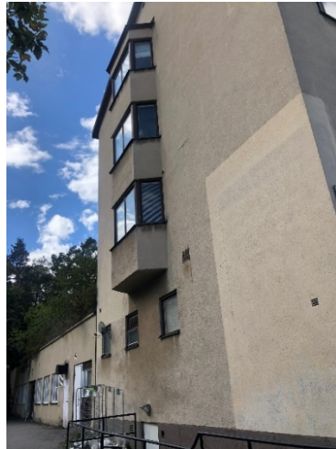
Bilder från bebyggelsen. Till vänster: vy mot gården. Till höger: vy mot infarten till garaget i den underbyggda gårdsdelen.