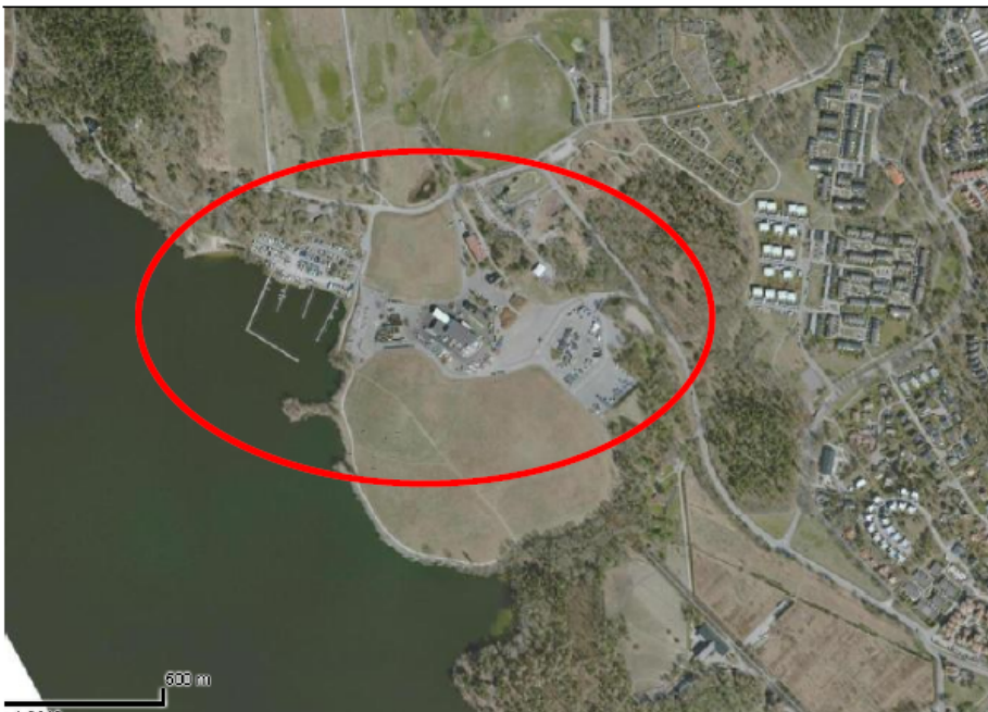
Ortofoto över föreslagen plats för energiproduktionsanläggning och återvinningscentral i Lövsta.

Förslaget bedöms innebära ca 100 nya arbetsplatser tillsammans för energiproduktionsanläggningen och återvinningscentralen.