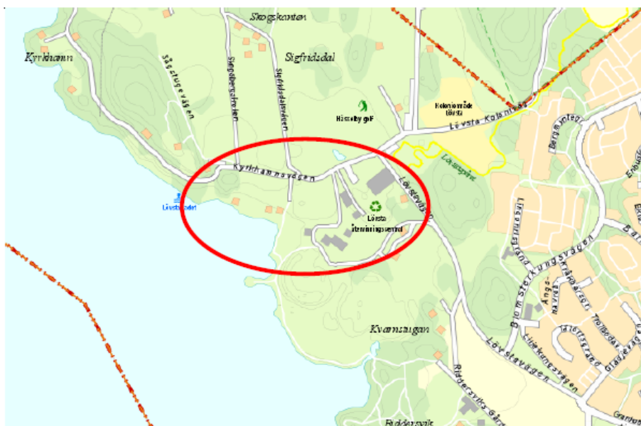
Den nya energiproduktionsanläggningens och nya återvinningscentralens läge i Lövsta, Hässelby Villastad.

Området ligger sydöst om Kyrkhamn, där planer finns på att inrätta ett naturreservat. Området ligger vidare nordväst om Riddersvik, där trädskolans område håller på att detaljplanläggas för bostadsbebyggelse. Längs Mälarens strand löper en strandpromenad.