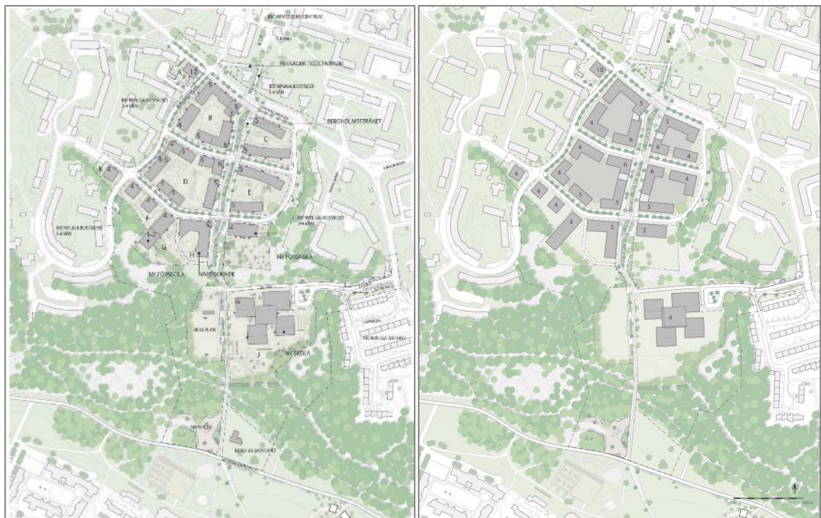
Strukturplan från samrådsförslaget

Med anledning av de synpunkter som framförts under samrådet har kontoret justerat förslaget för att uppnå en tydligare struktur och en mer sammanhängande gestaltning av bebyggelse med fokus på utformning av kopplingen mellan Bagarmossen och Skarpnäck. Bergholmstråkets sträckning är en viktig del av planens syfte och föreslås inte ändras. De föreslagna byggnadshöjderna bedöms vara välvägdade med hänsyn till omgivningen. Det höga huset föreslås sänkas till cirka tio våningar för att harmoniera med de befintliga höga husen i Bagarmossen.