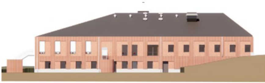
Illustrationsbild över ny byggnad, Hus L, fasad mot skolgård.