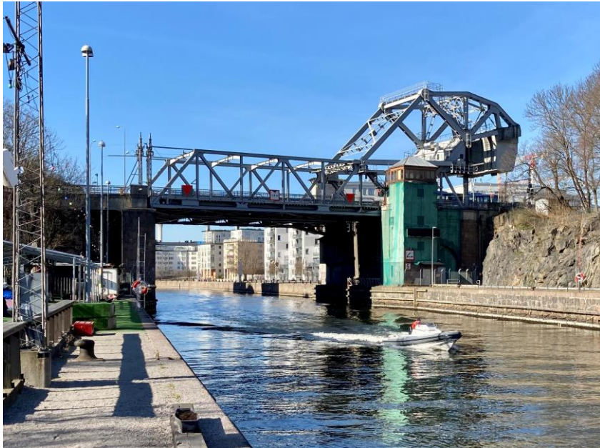
Bild 2. Norra Danviksbron, från sidan norrifrån, före påbörjad renovering.

Orsaken till föreliggande förslag till förnyat genomförandebeslut är konstaterade kostnadsökningar för projektet sedan det ursprungliga genomförandebeslutet. I övrigt är gällande genomförandebeslut fortfarande aktuellt och inga förändringar i omfattning eller utförande föreslås i föreliggande ärende.