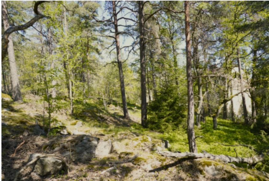
Figur 2. Majroskogen domineras av flerskiktad skog med lång trädkontinuitet.

I området finns fyra registrerade nyckelbiotoper – dessa områden utgör reservatets värdekärnor tillsammans med det mycket gamla tallskogsparti och en äldre hällmarkstallskog som ligger i reservatets norra del.