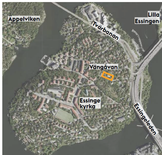
Flygbild över Stora Essingen, med Vängåvan centralt i bilden.

Kungsholmens lekplatser nyttjas av många barn och vuxna dagligen. De utgör inte bara lekmiljöer för små barn utan fungerar även som samlingsplatser, kalasplatser, utflyktsmål och platser för ungdomar att träffas och hänga. Vid tre av stadsdelsområdets lekplatser finns även mycket välbesökta och omtyckta parkleksverksamheter. Vängåvan utgör en av dessa. Lekplatsen med sitt parklekshus är centralt belägen på Stora Essingen och är en populär och självklar mötesplats för barn, ungdomar och medföljande vuxna. Parkleksverksamheten drivs av en föräldraförening i samverkan med stadsdelsförvaltningen, genom en så kallad IOP (idéburet offentligt partnerskap). Verksamheten har bland annat organiserad fritidsverksamhet för barn i skolåldern under eftermiddagar och kvällar.