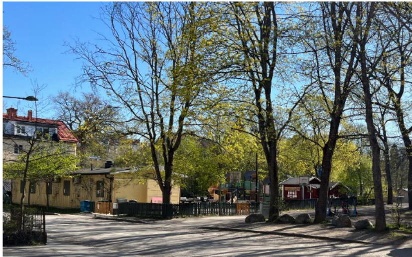
Vy mot parkens västra entré från Essinge Kyrkväg.

bemannade parklekar, parkteatrar och plaskdammar blev viktiga inslag och det var i den här andan som Vängåvan planerades.