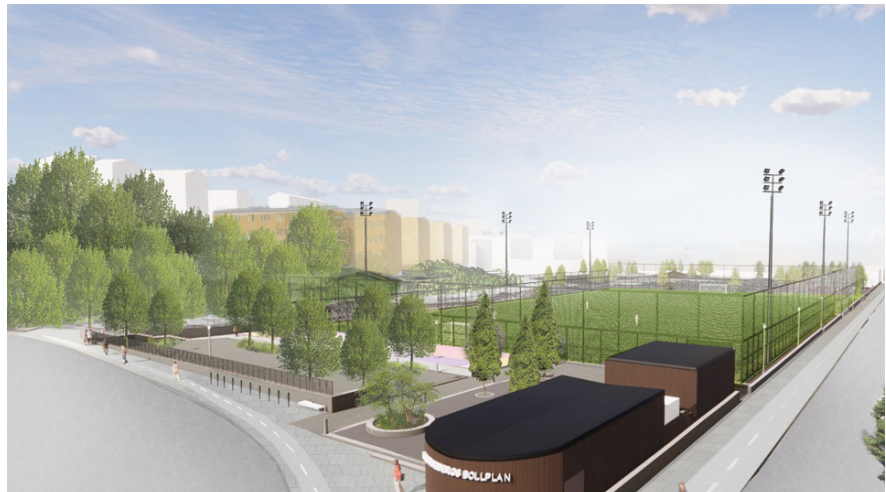
Visionsbild. Vy från korsningen Elersvägen - Nordenflychtsvägen. I förgrunden ses komplementbyggnaden. Bild från Planbeskrivningen, Cedervalls Arkitekter.

Planförslaget innebär att en 11-spelsplan anläggs i Kristinebergs strandpark på befintlig 7-spelsplan samt på del av befintlig parkyta och tennishall (som står på parkmark). Föreslagen plan innebär att den befintliga tennishallen rivs och ersätts med en underjordisk tennishall i Stadshagen. På platsen för den befintliga tennishallen kommer delvis park och delvis 11-spelsplanen att anläggas. Enligt planbeskrivningen pågår en utredning om en ny plats på Kungsholmen för den 7-spelsplanen som i och med planförslaget tas bort i Kristinebergs strandpark.