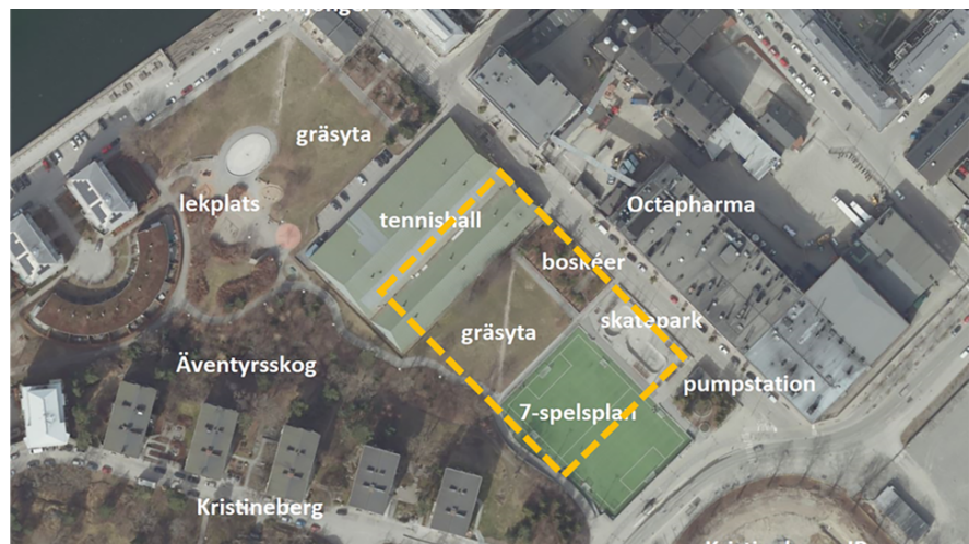
Ortofoto över Kristinebergs strandpark och dess olika delar. Gula streckade linjer markerar ungefärligt område för den nya 11-spelplanens placering.

tillfälligt bygglov i väntan på att flyttas till Stadshagen i enlighet med antagen detaljplan för Stadshagen.