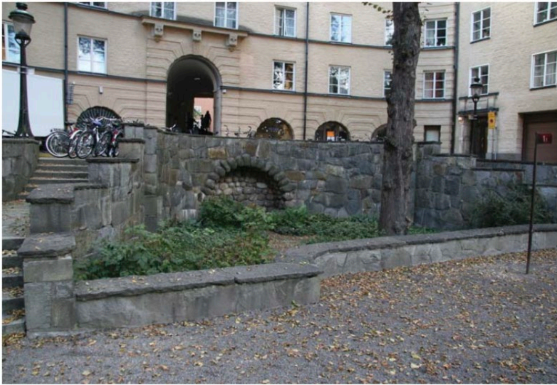
Resterna av vattenanläggningen.