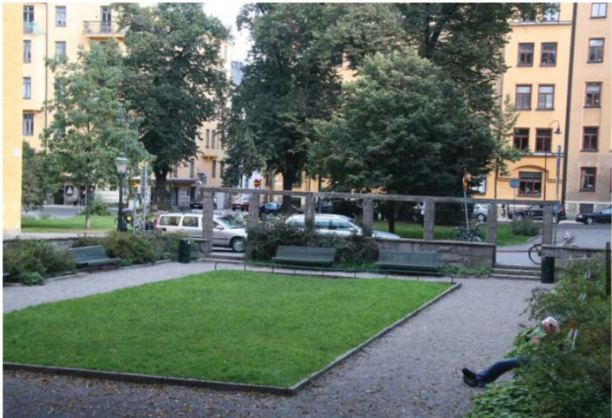
Den västra delen med sin gräsyta och sittytor runt om.