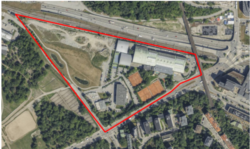
Planområdet markerad med röd ram. Norra länken/Värtabanan i norr.

Stadsbyggnadskontoret har tagit fram ett förslag till detaljplan för Storängsbotten, ett område som ligger som en kil mellan Lidingövägen, Storängsvägen och Norra länken/Värtabanan. Bland andra Norra innerstadens stadsdelsnämnd har fått detaljplaneförslaget på remiss. Remisstiden pågår från den 17 mars till den 27 april 2026.