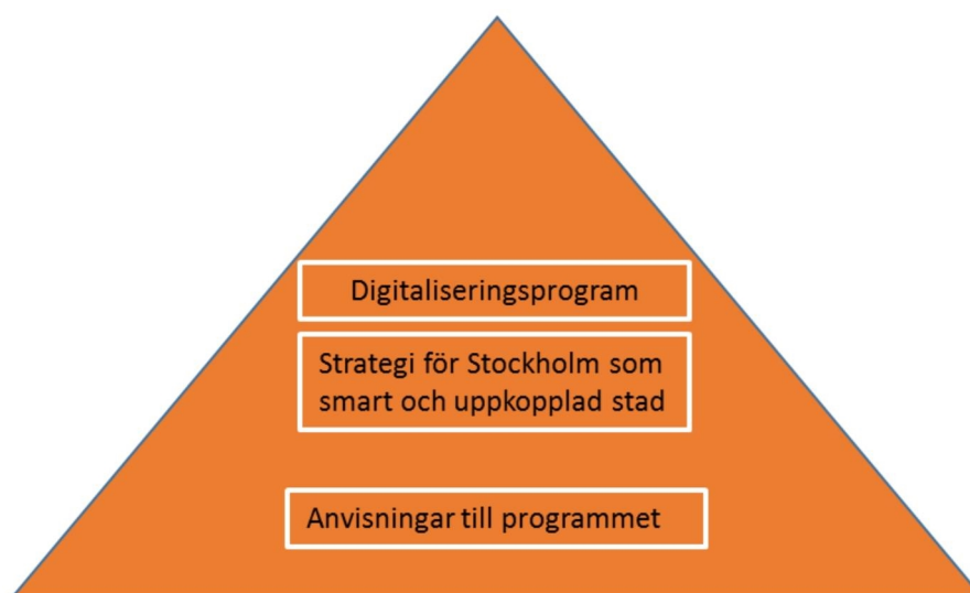
Figur 1: Digitaliseringsprogrammet är ett styrdokument med internt fokus. Strategi för Stockholm som smart och uppkopplad stad detaljerar målbilden och lägger grunden för genomförandet av stadens första stora initiativ som rör sakernas internet och användningen av stora datamängder. Anvisningarna förtydligar programmets innehåll och ger vägledning i hur programmet ska realiserars.

digitalisering och vidareutveckla den smarta staden. Strategin antar ett bredare perspektiv och involverar flera aktörer i regionen och ger tillsammans med digitaliseringsprogrammet en heltäckande beskrivning av stadens ambitioner och mål på digitaliseringsområdet.