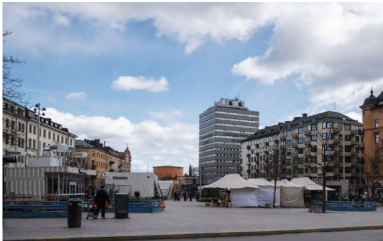
Befintlig situation. Läkarhuset sett från Odenplan.