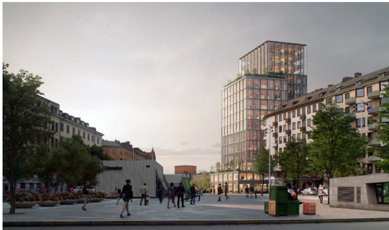
Föreslagen byggnad, sett från Odenplan.

Den planerade byggnaden medför, i relation till dagens Läkarhus och omkringliggande bebyggelse, en högre byggnad om totalt 15 våningar ovan mark. Utöver detta avses fem befintliga källarplaner under mark huvudsakligen bevaras. Bevarandet av källarplanerna möjliggörs genom att det nya huset avses uppföras i en lätt konstruktion, exempelvis i trä. Att bevara källarplanerna ger miljömässiga fördelar samt kan minska störningar och transporter under byggtiden. Den eventuella trästommen avses exponeras i fasad och bidra till fasaduttrycket. Möjligheten till trästomme är positivt, sett utifrån klimathänseende och minskade koldioxidutsläpp. En trästomme kan även bidra till minskat buller och störningar under genomförandet.