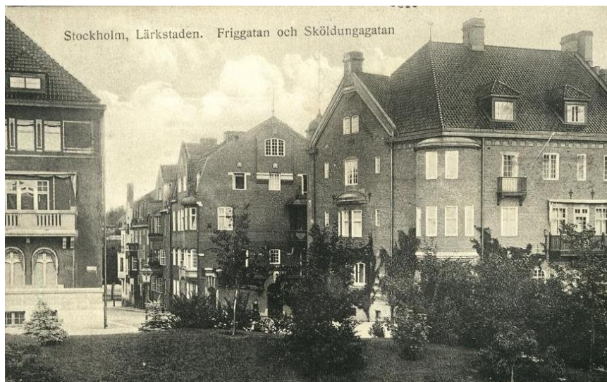
Vykort från 1920-talet, Friggagatan – Sköldungagatan, kvarteret Sånglärkan till höger.

Området bestod vid uppförandet till största delen av sammanbyggda enfamiljshus med bakomliggande trädgårdar. Idag finns endast ett begränsat antal enfamiljshus kvar i området. Flertal byggnader har konverterats till flerfamiljshus eller kontoriserats.