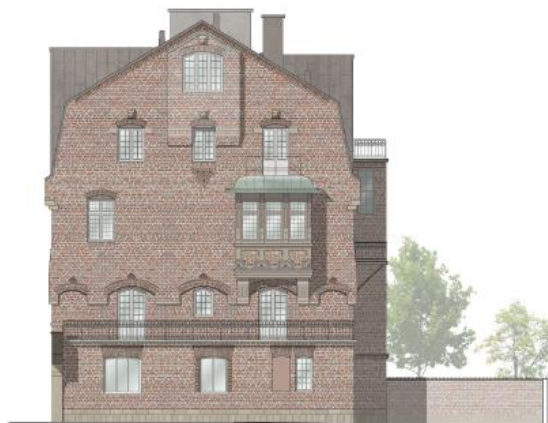
Sköldungagatan 4, befintlig gavelfasad