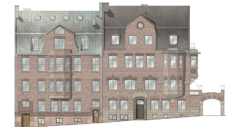
Gatufasader för Sköldungagatan 6 och 4. Befintliga fasader till vänster och fasader med rekonstruerade fönster enligt planförslag till höger.

På Sköldungagatan 4 föreslås ett fönster i gårdsfasadens bottenvåning att ersättas med en spröjsad fönsterdörr, så att trädgården och köket förbinds med varandra. Ytterligare några öppningar i fasaden mot gården föreslås förändras för att möta den nya verksamhetens krav.