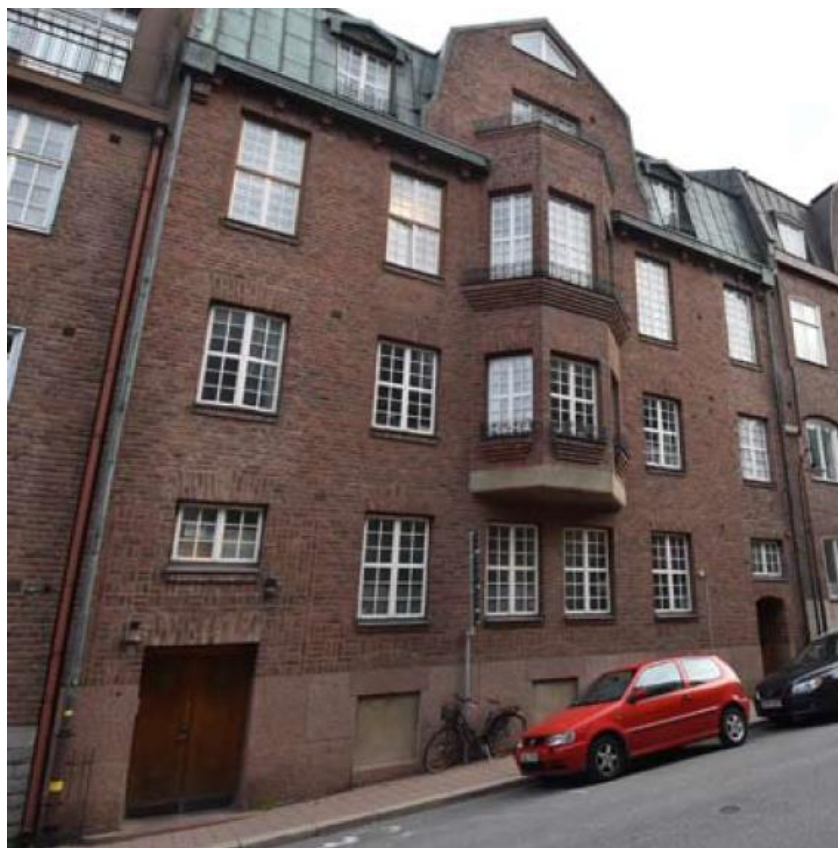
Sköldungagatan 6, gatufasad.

Huset är ombyggt vid flera tillfällen. Bland annat har fasadens vertikalförskjutna fönstersättning ändrats. År 1971 byggdes hela huset om för kontorsändamål. 1990 slogs huset ihop med byggnaden på Sköldungagatan 4.