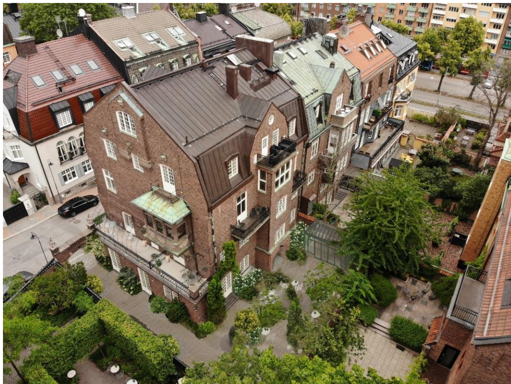
Sköldungagatan 4 och 6, planförslag med växthus och ny grön gårdsgestaltning