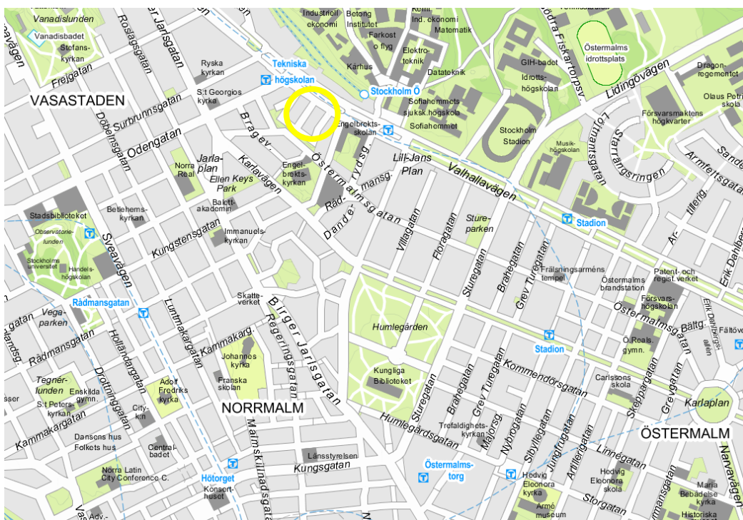
Kvarteret Sånglärkan markerat med en gul ring.