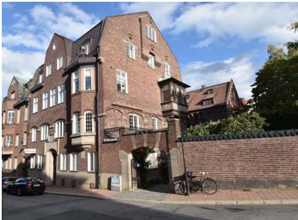
Sköldungagatan 4, gatufasad samt gavelfasad mot söder och entrégården.

Byggnaden har byggts om ett flertal gånger, för såväl bostads- som kontorsändamål. År 1990 sammanslogs denna fastighet med den intilliggande fastigheten och väggen mellan de två husen öppnades upp på samtliga plan. I samband med denna ombyggnad skedde omfattande förändringar i husets inre och flera interiörer revs.