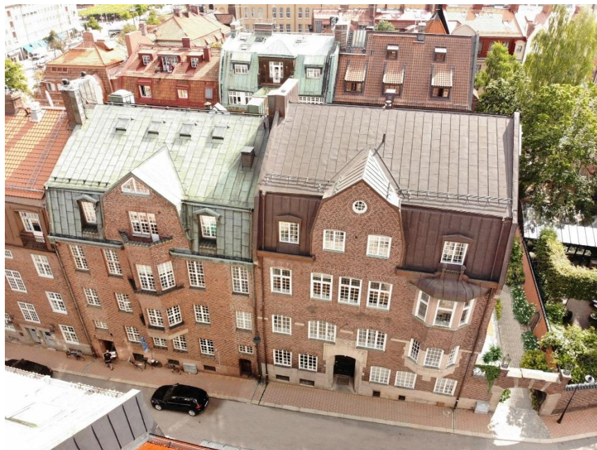
Sköldungagatan 6 och 4 fasader med rekonstruerade fönster och ny markgestaltning enligt planförslag.