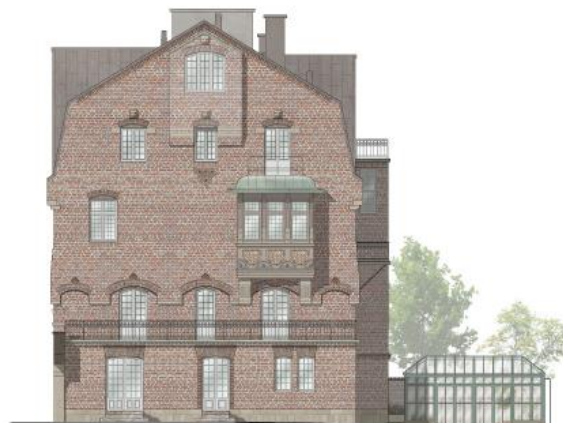
Sköldungagatan 4, gavelfasad enligt planförslag

Källarplanet inreds med beredningskök samt service- och förvaringsutrymmen. För att minimera ingrepp i befintlig byggnad föreslås ett teknikrum etableras under det orangeri som föreslås uppföras på gården. Teknikrummet nås via källaren.