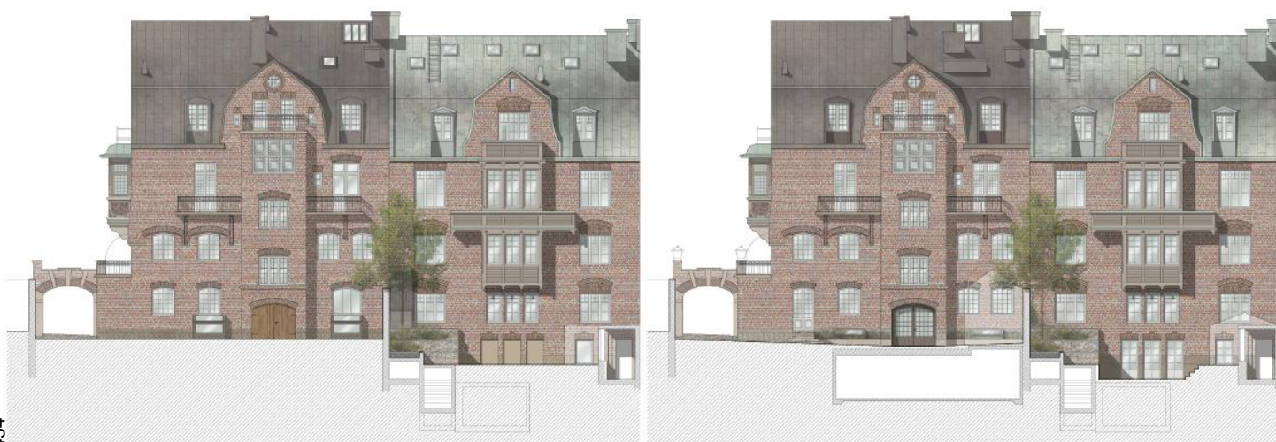
Gårdsfasader för Sköldungagatan 4 och 6. Befintliga fasader till vänster och fasader med rekonstruerade fönster och ändring i bottenvåning samt tak enligt planförslag till höger.

På gården föreslås marknivån sänkas cirka en meter i anslutning till fasaden. Avsikten är att skapa en möjlighet att gå ut på gården direkt från det något försänkta entréplanet. Tre stycken igensatta källarfönster återupptas och ersätts med fönsterdörrar.