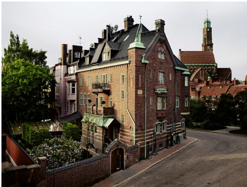
Ett Hem på Sköldungagatan 2, vars befintliga verksamhet avses utvecklas inom grannbyggnaden (till vänster utanför bild).

Tillsammans med förlagsverksamheten kan hotellet möta de kraven på arbetsro, service och enskildhet som krävs för att ta emot världsartister i Stockholm.