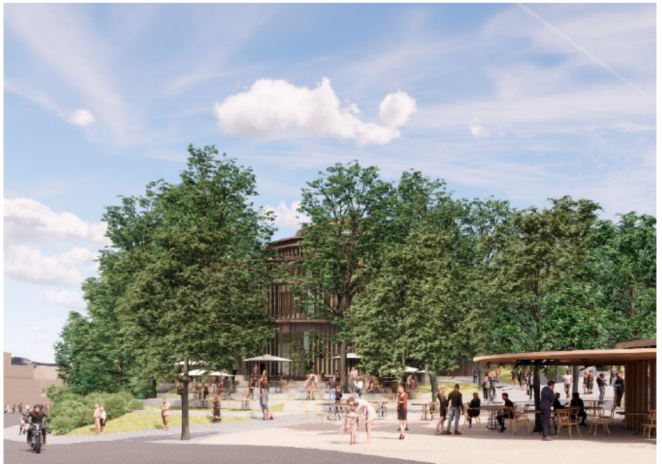
Nya Gubbhyllan från Djurgårdsvägen i korsningen med Hazeliusbacken. Paviljongen till höger i bilden ligger utanför planområdet.