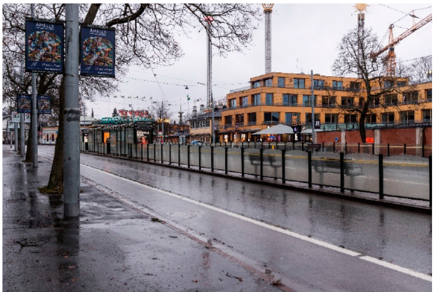
Konsthallen 2 sedd söderifrån på Djurgårdsvägen.

Inom Konsthallen 2 ligger ABBA-museet och Pop House Hotel. Byggnaden uppfördes 2013, ritad av arkitekt Johan Celsing.