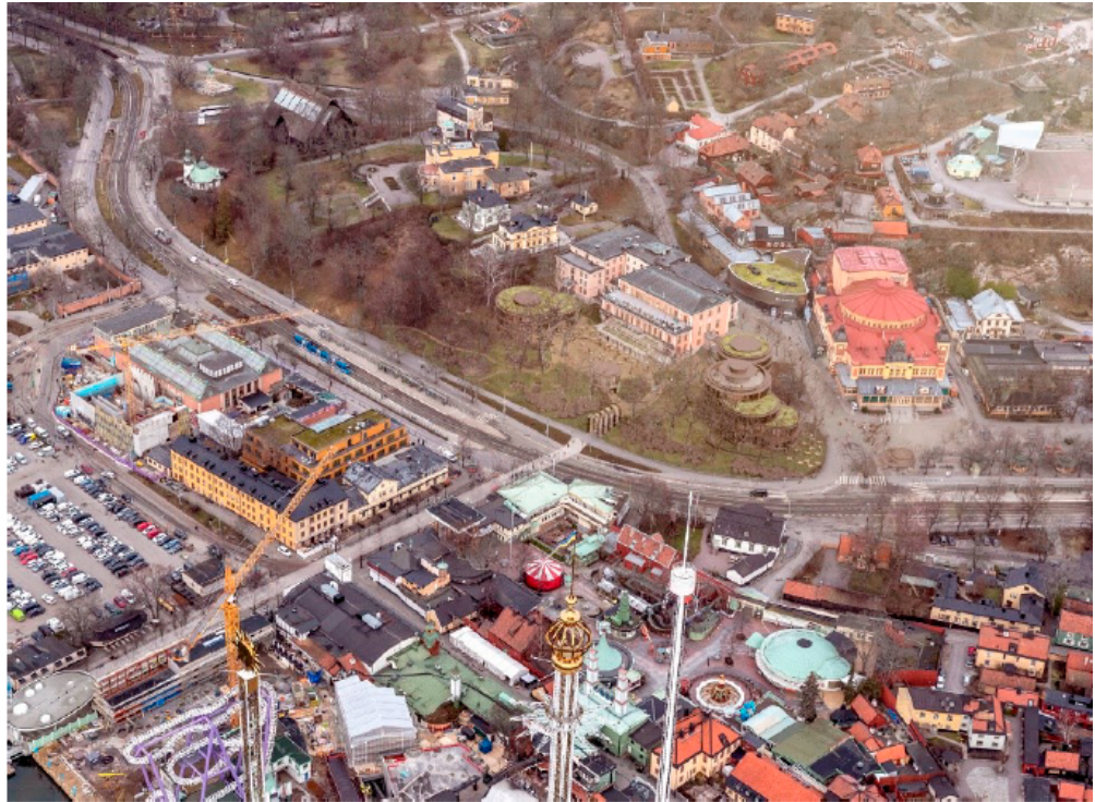
Flygbild över området med planförslaget inlagt.

glasveranda togs fram av Curt Björklund redan på 1930-talet men genomfördes aldrig.