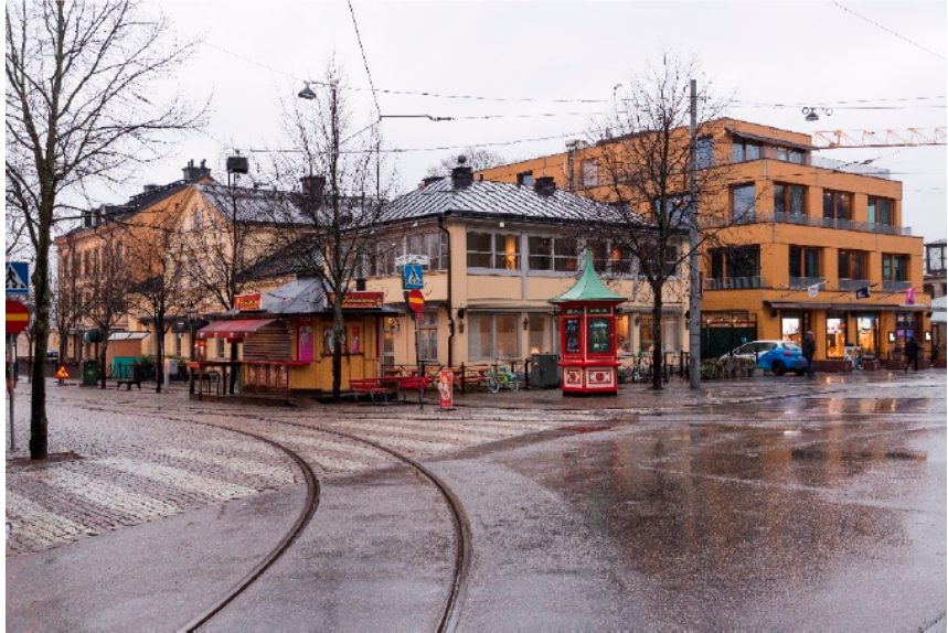
Konsthallen 15 i hörnet av Djurgårdsvägen och Allmänna gränd. Närmast Djurgårdsvägen syns verandabyggnaden som tillkom 1927-28.

Inom Konsthallen 2 ligger ABBA-museet och Pop House Hotel. Byggnaden uppfördes 2013, ritad av arkitekt Johan Celsing.