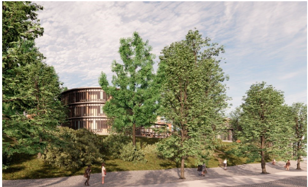
Nya Moriska från Djurgårdsvägen.

Hasselbacken finns därmed delvis kvar. Nya Moriska innehåller hotellrum och servering på bottenvåningen.