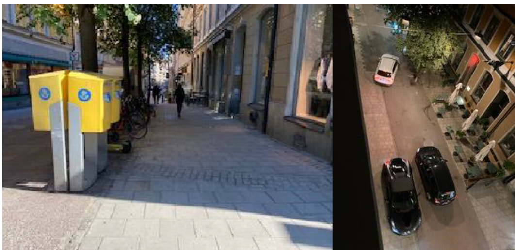
Bild 6 och 7. Eftersom fordon nattetid inte förstår att den norra pollaren åker ner när bilen närmar sig, så används "smitvägen" vid bostadsfasad ner från Humlegårdsgatan. Denna väg används även hela tiden för de som kommer ner för Grev Turegatan och vill åka mot enkelriktat vidare ner till Stureplan och pollaren ska hindra detta.