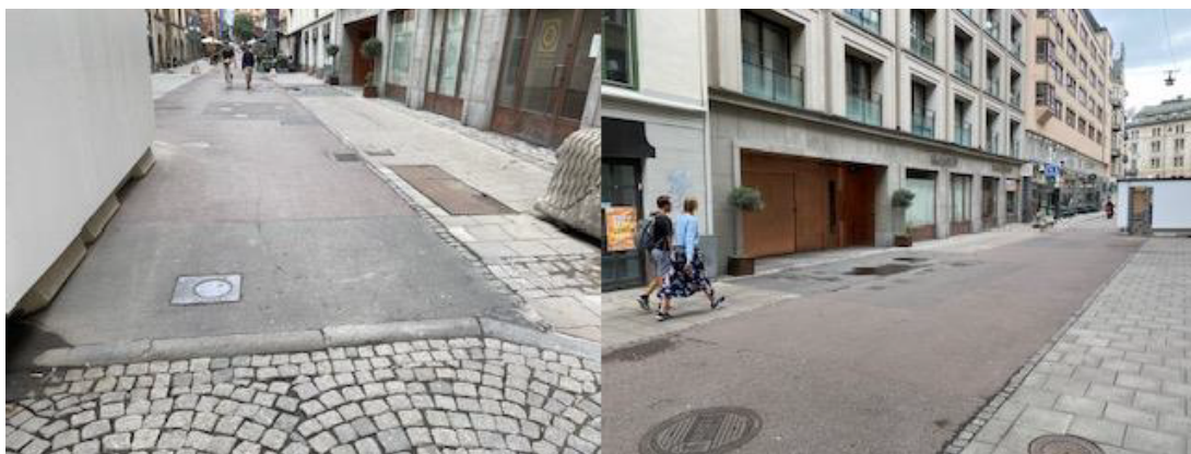
Bild 1 & 2 Felplacerad pollare sedan decennier. Nybyggt hus 2012-2013 med boendegarage. Hur tänkte Stockholm Stad där - med placering av nybyggt bostadsgarage på gågatan, långsiktigt och hållbart? Pollare förstörs av byggets ständiga tunga fordon och betongstation. Betonglejon flyttas inåt mot fasad, ifrån vägren. Pollens funktion blir då funktionslös. Pollen borde flyttas norrut – förbi garaget likaså lejonen på respektive trottoarkant.