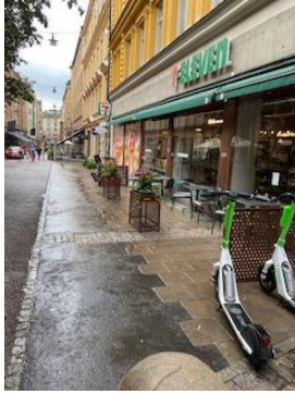
Bild 5 Ej avgränsad uteservering, dygnet runt öppet och berusade och ungdomsgängs vattenhål nattetid. Då de gärna sitter ute på uteserveringen (som borde vara avgränsad och stängd) eller på någon av alla de andra uteserveringarna på gatan som inte är avgränsade i enlighet med villkorsbilagen och därmed tillgängliga)