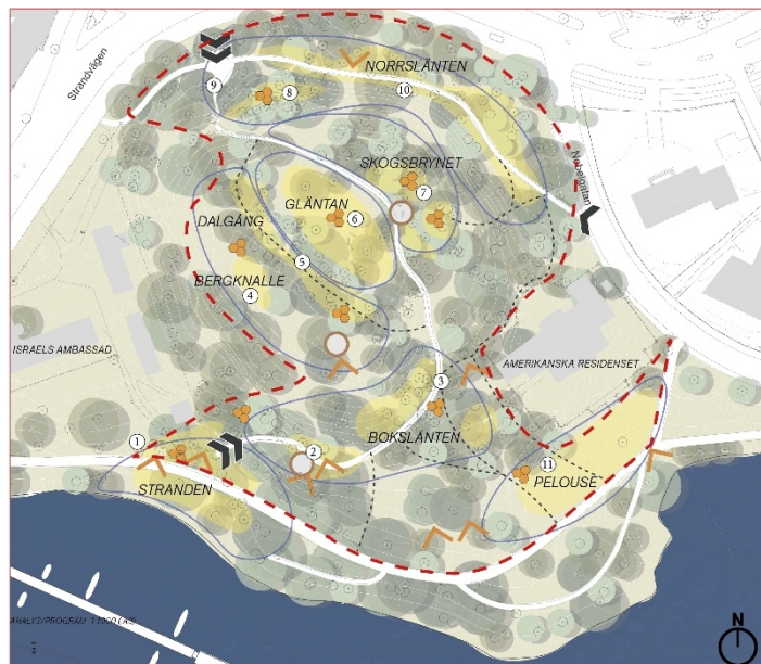
Karta över Nobelparken med dess olika identifierade platser utmärkta. Entréer har markerats med blå pilar och utblickar med gula pilar.

Strandstråket fortsätter utmed Djurgårdsbrunnsvikens norra sida ut på Djurgården. Under Skogsinstitutets dagar i parken planterades här ett arboretum av inhemska trädarter. Rester av arboretumet finns kvar i form av träden och här återfinns i dagsläget närmare 30 olika träd och buskträd.