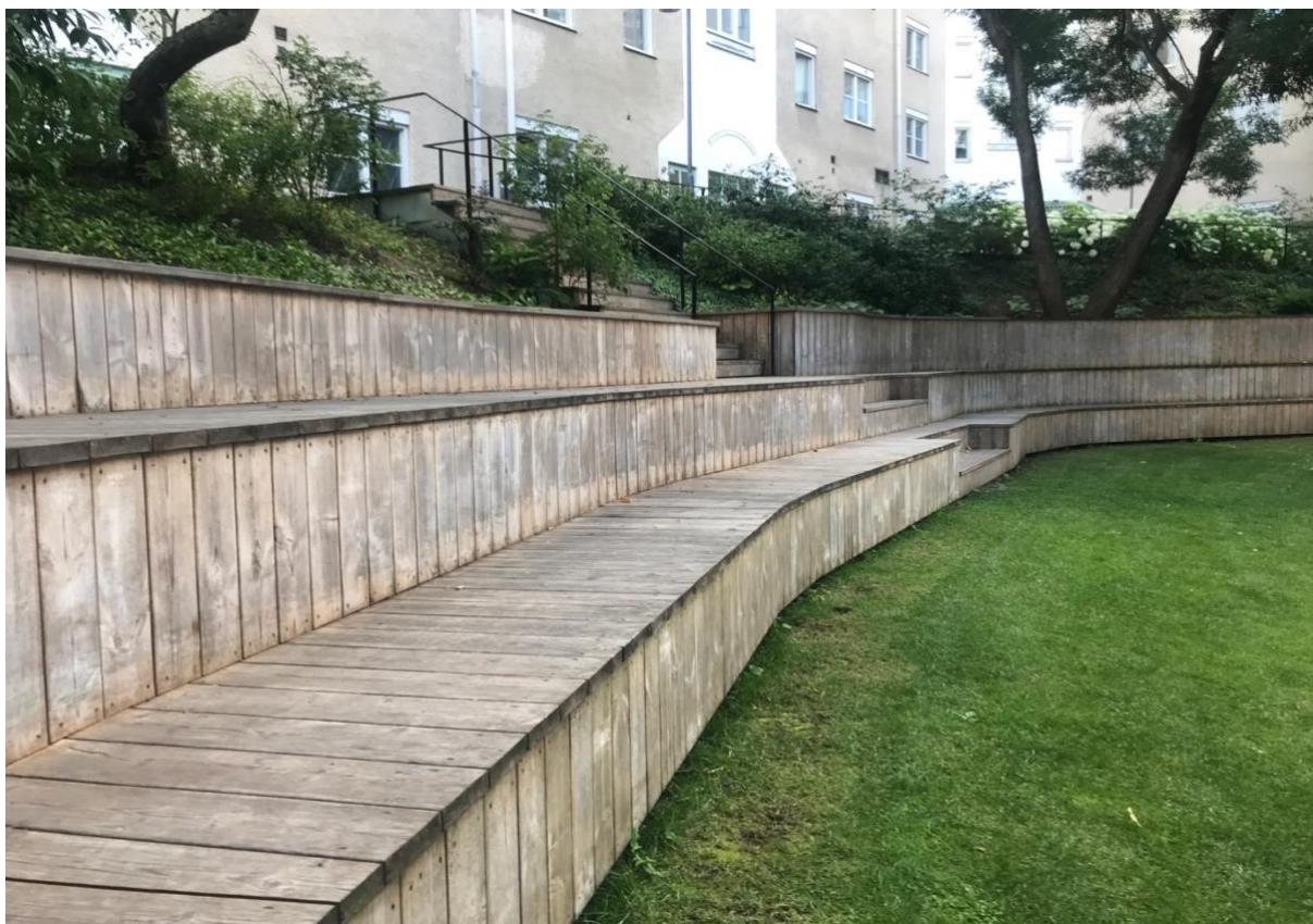
En fingervisning av hur sittplatserna kan se ut. H 1,5 x B 6 x D 3 meter. Inuti finns det plats för 15 kajaker.

Sittplatserna kan fungera som viloplats för de som tränar och andra som vill bara sätta sig en stund. Den kan också fungera som sittplats för utomhusteater, cirkus, musik eller om man vill ha barnkalas med grill och lek. På baksidan av sittplatserna kan man bygga klättervägg för barn.