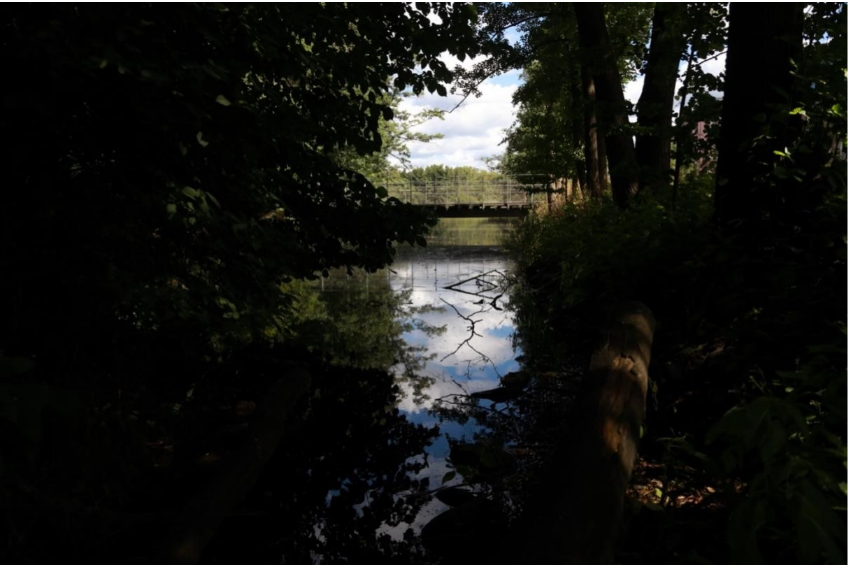
Bilden visar hur man kan paddla iväg från platsen.