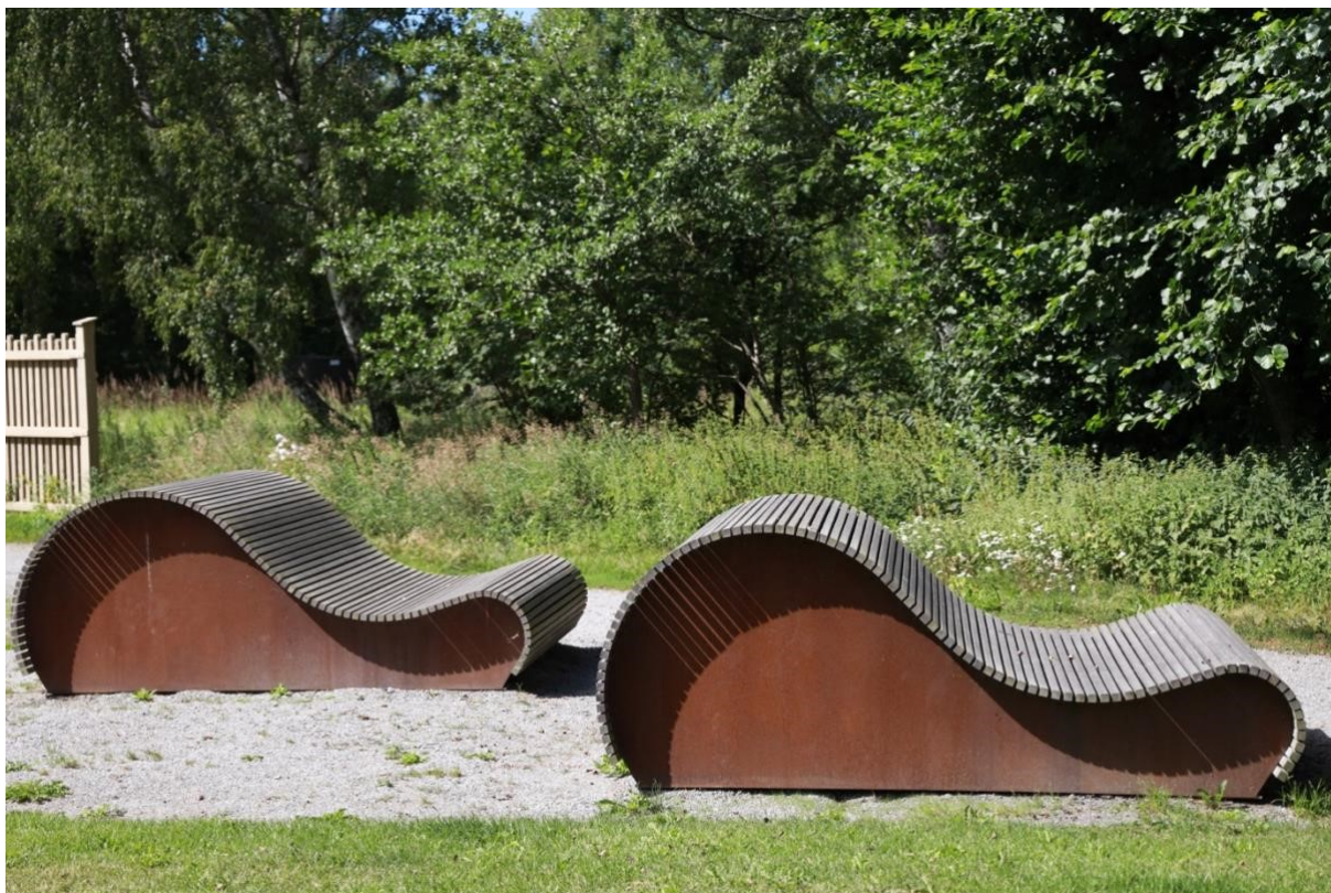
Dessa bänkar finns lite överallt i Norra Djurgårdsstaden.

Dubbelt så långa och något högre kan dessa bänkar rymma fem kajaker. Bänkarna kan stå jämte stigarna så folk kan ligga och njuta av den fina naturen eller vila efter träningspasset. På höstkanten kan de plocka äpple från de olika äppelträden och jämföra smaken.