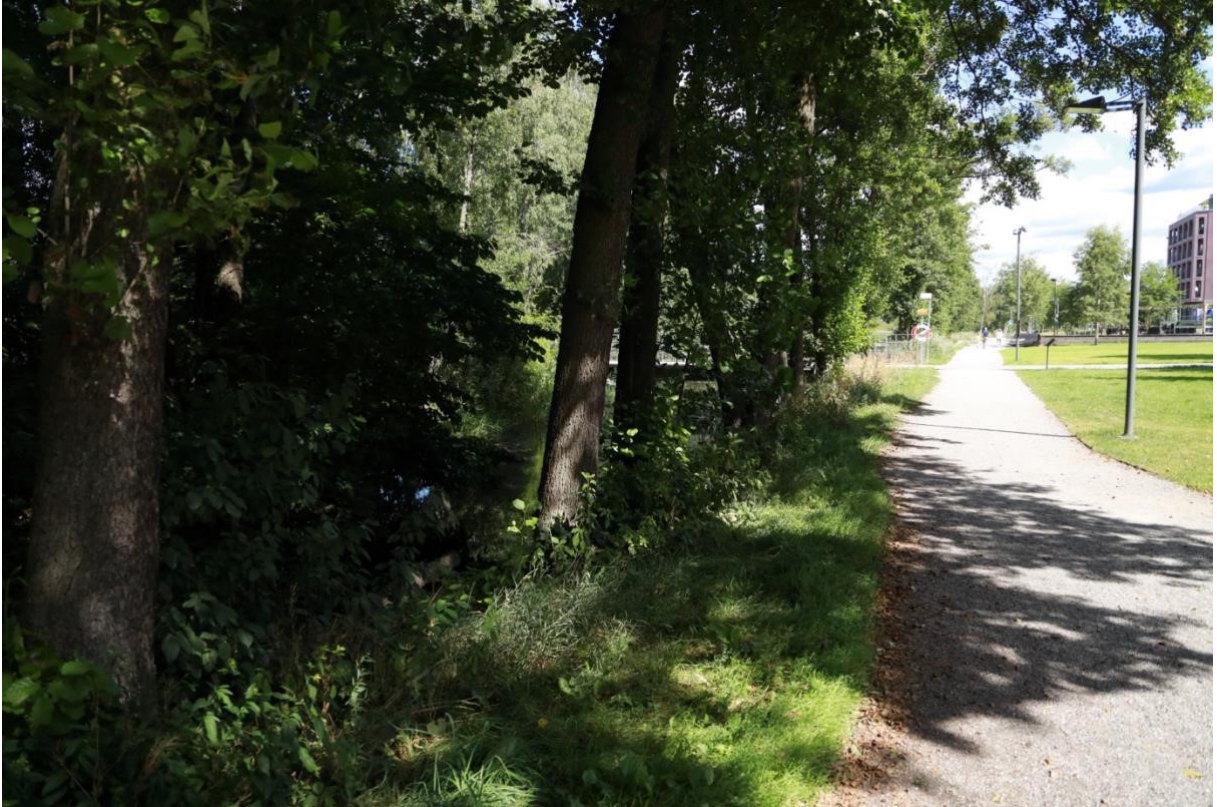
Här mellan träden närmast i bilden kan man lätt gå in med kajakerna.