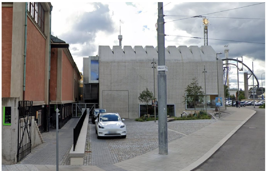
Vy över torget mot sydöst, sett från Falkenbergsgatan/Alkärret.

I öst gränsar planområdet till Liljevalchs konsthall som färdigställdes 1916. Byggnaden är ritad av Carl Bergsten och karaktäriseras av en stram klassicism med sparsamt dekorerade fasader och delvis exponerad betongkonstruktion.