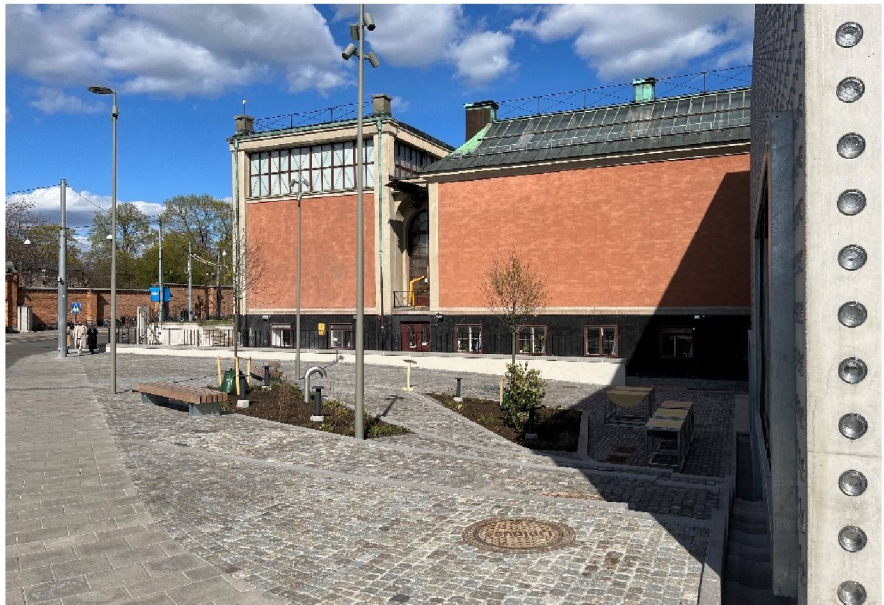
Vy över torget mot nordöst, sett från Falkenbergsgatan.