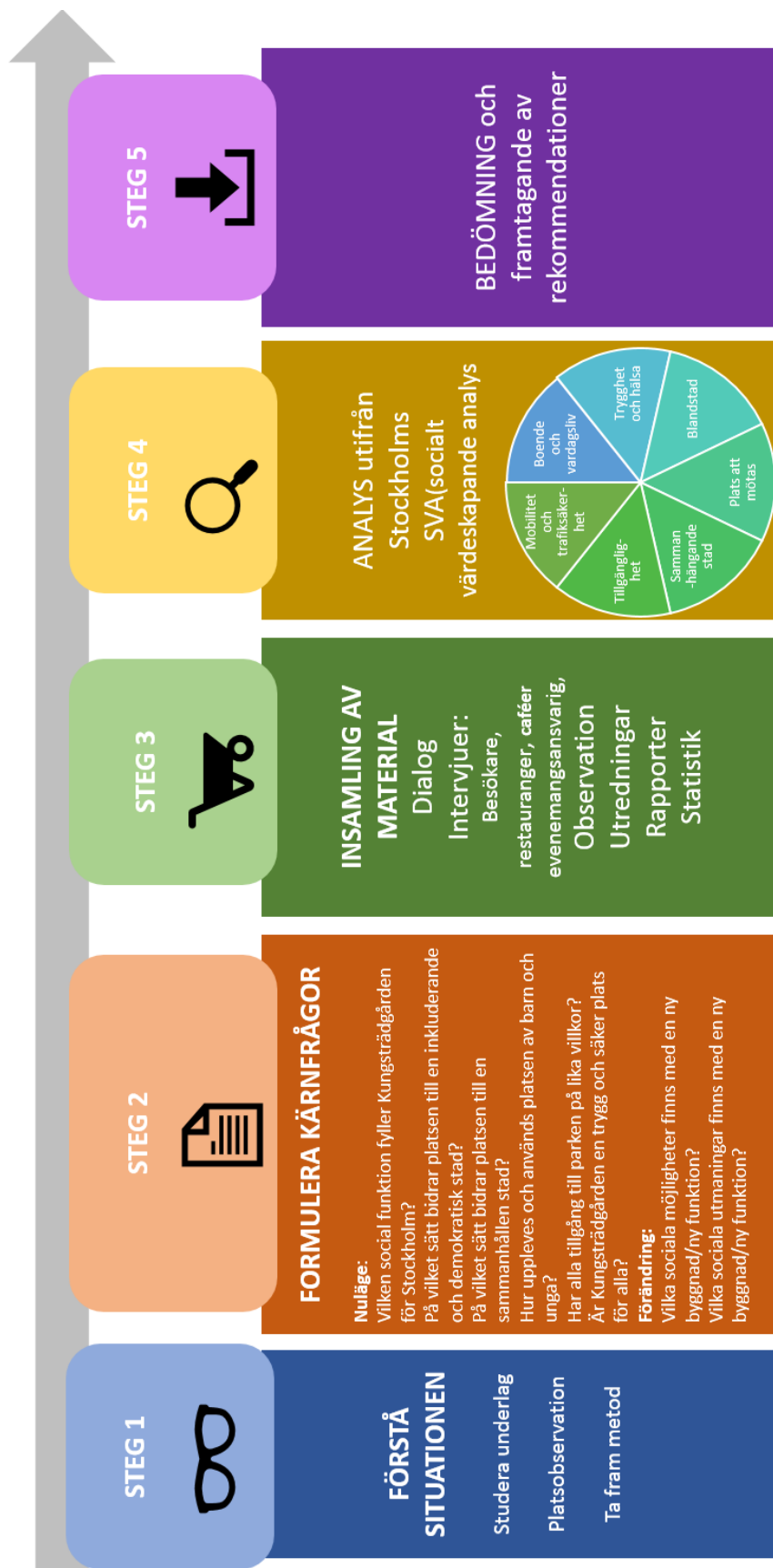
Figur 1: Beskriver arbetsprocessen för denna utredning