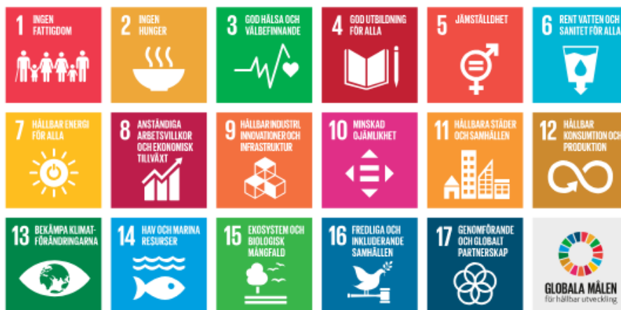
Figur 3: De hållbarhetsmål som projektet har störst potential att bidra positivt till

Baserat på workshopen samt med hänsyn till Swecos ovanstående analys av projektets påverkan på de sociala aspekterna kan Sju Sekel bidra med insatser som rör