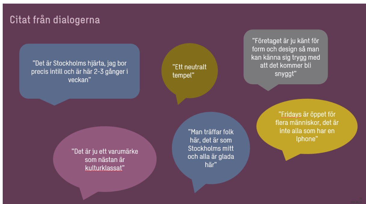
Figur 2: Citat från dialogerna i Kungsträdgården under våren 2018

Swecos bedömning är att det inte sker någon märkbar förändring när det gäller generell tillgänglighet i det nya förslaget och att tillgängligheten kommer att vara fortsatt god även efter förändringen. För mer specifik bedömning av fysisk tillgänglighet för besökare med funktionsvariationer, se Trafikutredningen i detta uppdrag. 18