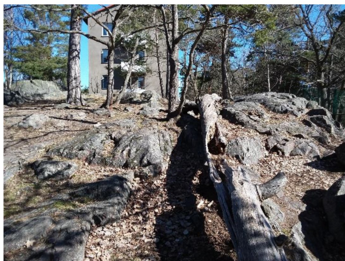
Figur 6. Solbelyst död ved.