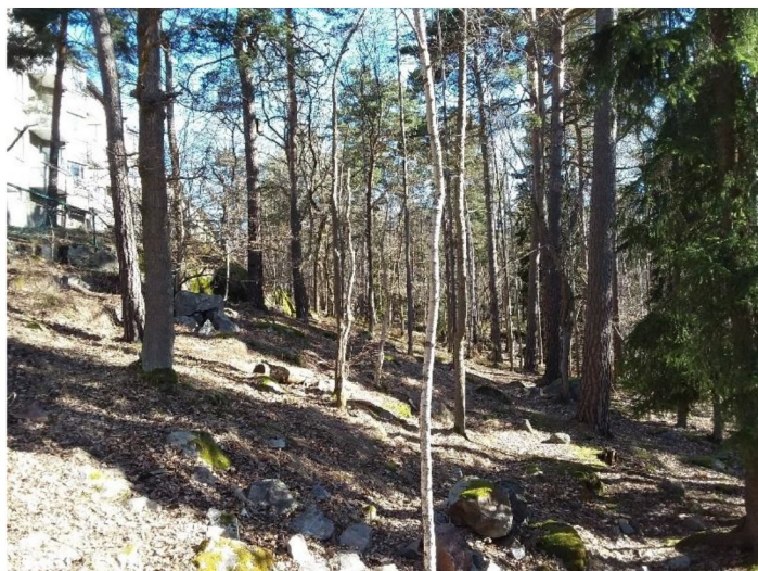
Figur 7. Klent löv och grövre barrträd i naturvärdesobjekt 2.

Naturvärdesobjektet hyser inga specifika högre naturvärden, men fungerar som buffertzoon för naturreservatet. Inga naturvårdarter påträffades men ett rikt fågelliv noterades, varför objektet anses vara av värde som fågelbiotop.