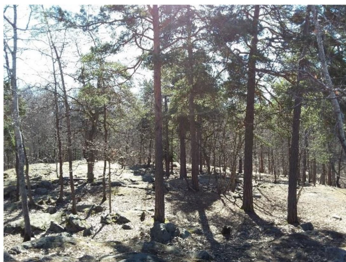
Figur 5. Hällmark med äldre tall i naturvärdesobjekt 1.

Fin hällmarkstallskog med en del äldre tall och förekomst av död ved (lågor). Förekomst av en naturvårdsart tillsammans med ett rikt fågelliv ger ett visst artvärde.