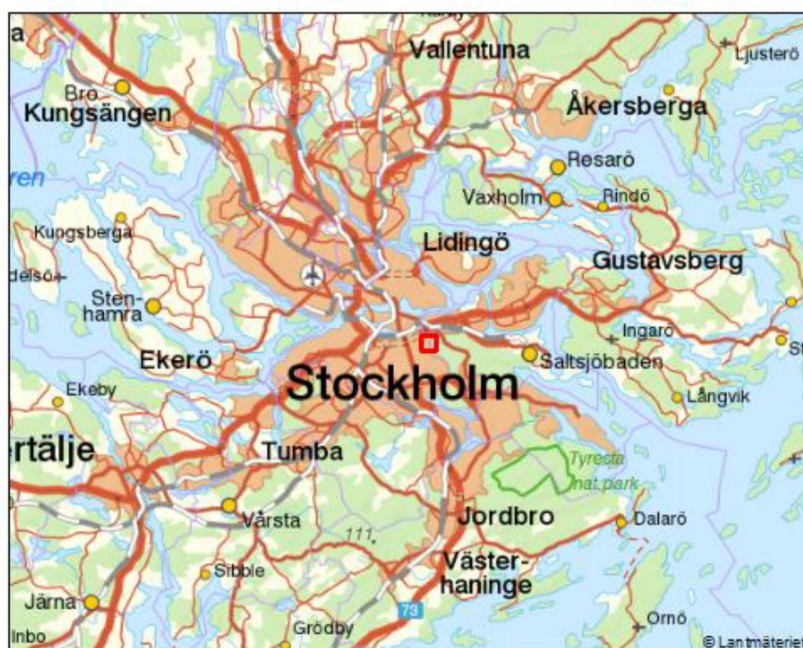
Figur 1. Översiktsskarta med Björkhagen utmärkt med röd kvadrat.

En NVI på förstudienivå har tidigare gjorts i området (Tyréns 2018).