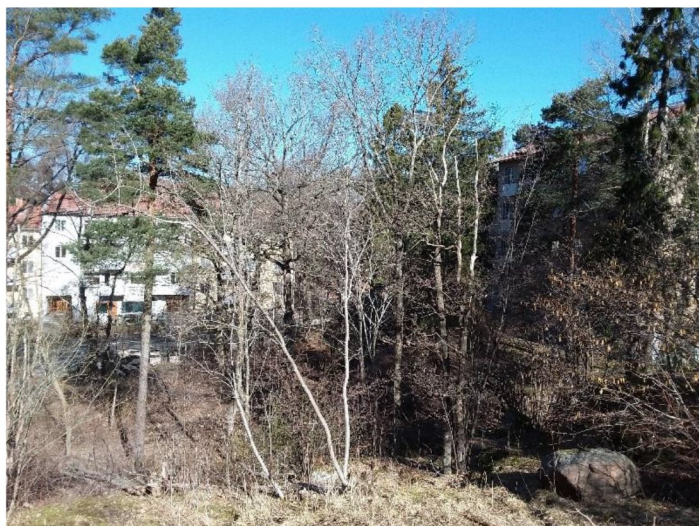
Figur 9. Äldre, högvuxta barrträd och ekar i naturvärdesobjekt 3.

Graden av naturlighet i naturvärdesobjektet är låg och inga naturvårdsarter påträffades. Däremot noterades ett rikt fågelliv, varför naturvärdesobjektet anses vara av värde som fågelbiotop. Förekomst av äldre och grövre träd ger ett visst biotopvärde.