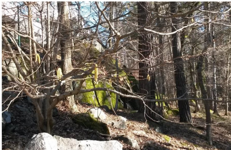
Figur 8. Hassel.