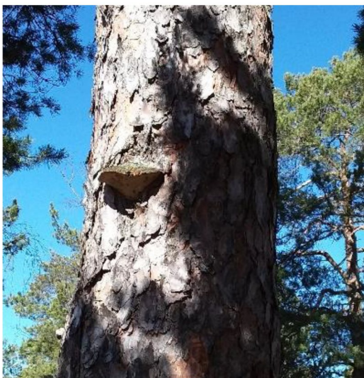
Figur 11. Naturvårdsarten talticka i naturvårdesobjekt 1.

En naturvårdsart påträffades: talticka (rödlistad som NT – nära hotad).