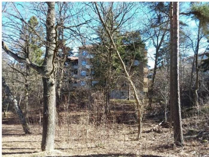
Figur 10. Äldre ek med en diameter på ca 60 cm i objektet.