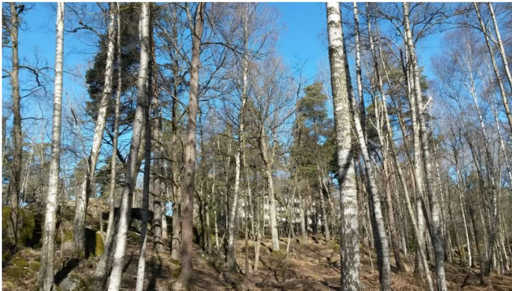
Figur 3. Foto upp mot södra delen av inventeringsområdet taget söderifrån från Nackareservatet.