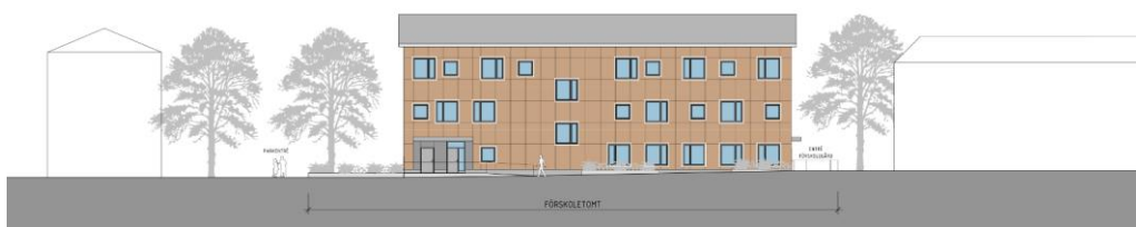
Skiss på möjlig utformning av förskolan, vy från norr. Aperto Landskapsarkitekter

Den förslagna förskolan uppförs i tre våningar och innehåller fem avdelningar med 90-100 barn. En utökning från två till fem avdelningar, vilket den tidigare förskolan huserade, innebär mer än en fördubbling av antalet barn på förskolan.