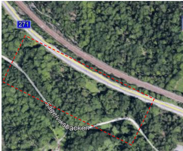
Bild 4.1 Foto över området