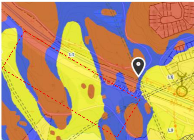
Figur 4.2 Utdrag ur Byggnadsgeologiska kartan. Gul=lera, Blå=morän och Rött=berg

Generella geotekniska förhållanden, se figur 4.2. Ett lerområde finns centralt i området som karakteriseras av tunna jordlager och berg i dagen. Lermäktigheten ökar sannolikt åt söder. Lermäktigheten är liten i den norra delen, enligt Byggnadsgeologiska kartan, endast 1 m.