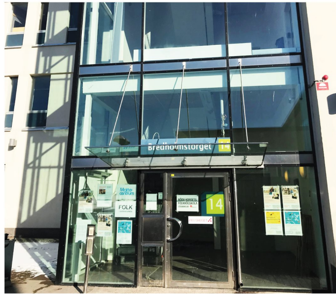
1. Bredholmstorget 14. Entré bl.a. Röda Korsets Folkhögskola.