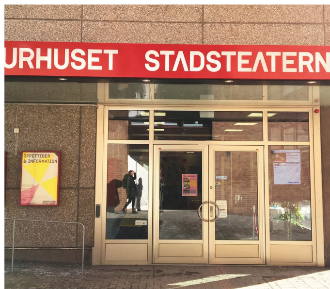
7. Bodholmsgången. Entré till kulturhuset.