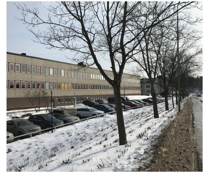
3. Ekholmsvägen. Markparkering vid Skärholmens gymnasium.