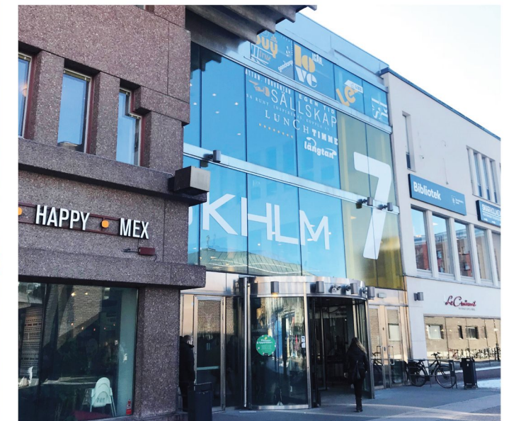
6. Skärholmen centrum. Köpcentrumets huvudentré.