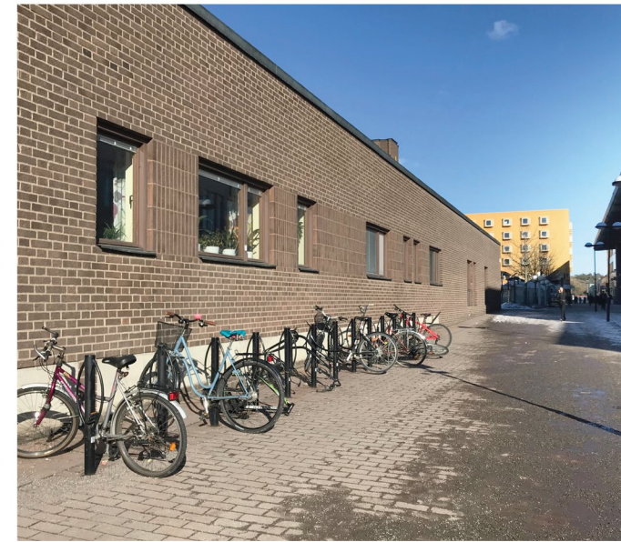
2. Bodholmsgången. Befintlig cykelparkering.