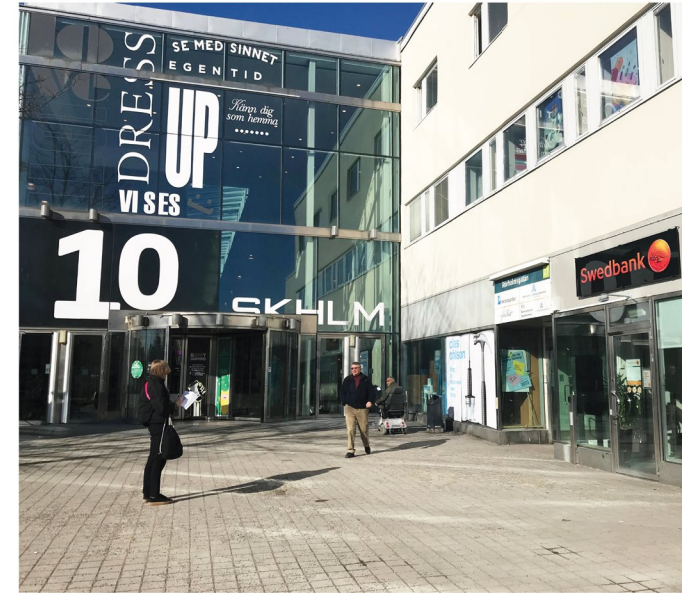
2. Måsholmstorget. Köpcentrumets södra huvudentré.