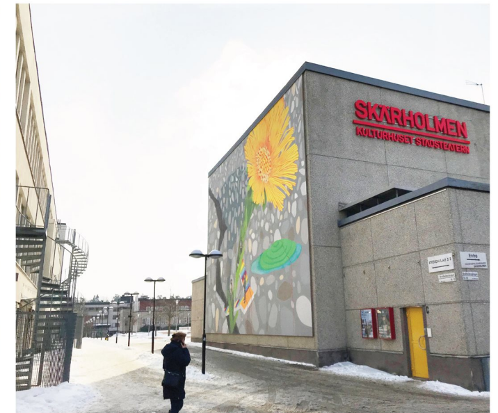
6. Bredholmstorget. Kulturhuset i förgrunden. Gångpassage mot Bredholmstorget från Bodholmsgången.