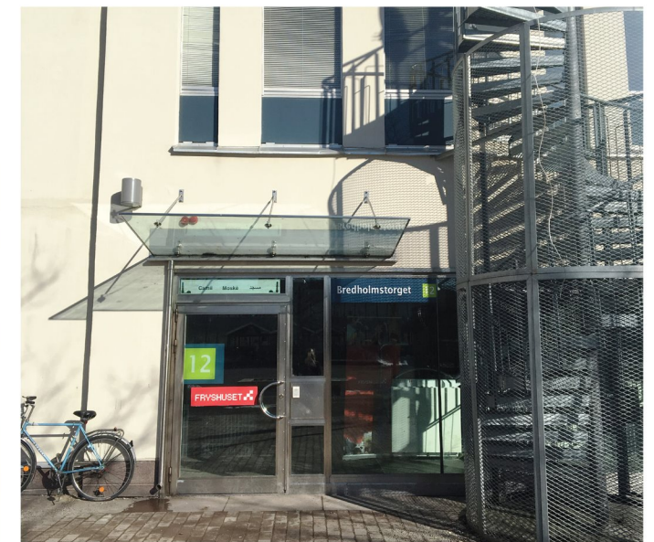
9. Bredholmstorget 12. Entré till moskén och Fryshuset.