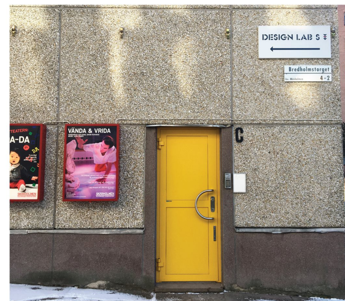
8. Bodholmsgången. Personalingång till kulturhuset.