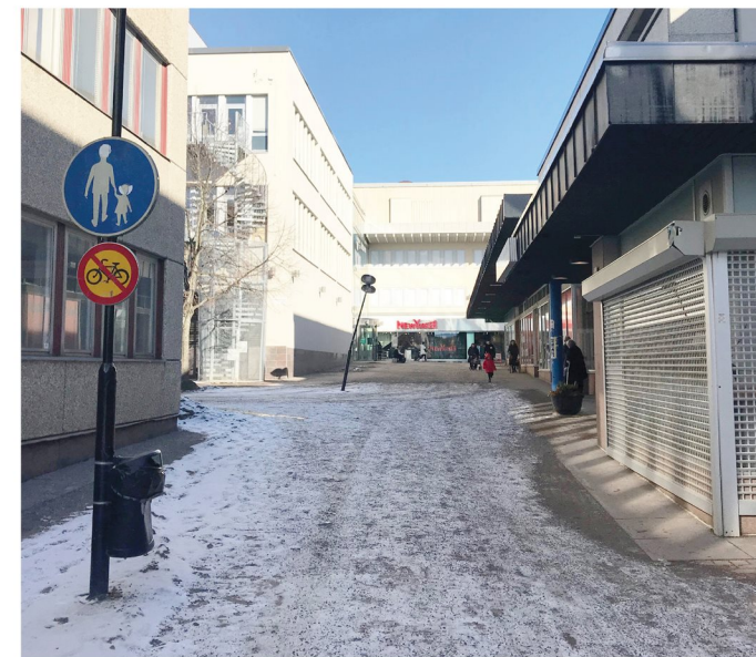
8. Portholmsgången. Cykling förbjuden.