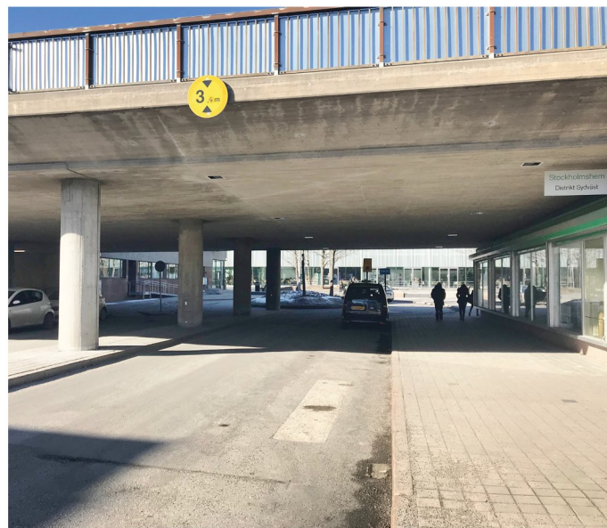
7. Måsholmstorget. Gångpassage från syd under motorvägsåfart.