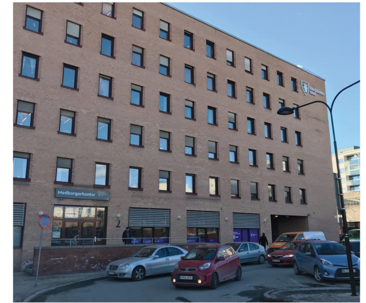
3. Bodholmsplan. Angöring till centrum.