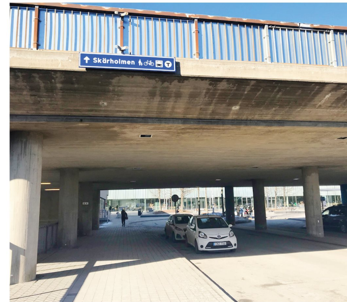
5. Måsholmstorget. Entrépassage från syd under motorvägsåfart.