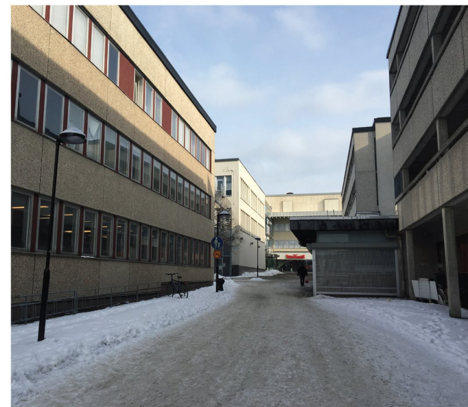
8. Portholmsgången. Annexet till vänster, serviceboendet till höger.