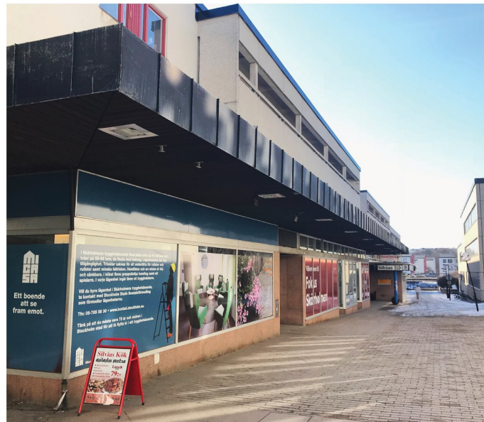
4. Portholmsgången. Bottenvåning på serviceboendet.