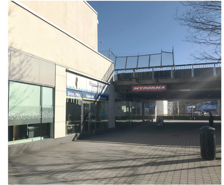
3. Måsholmstorget. Bottenvåning längs torgets östra sida.