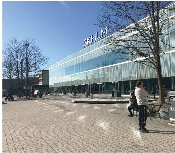
1. Måsholmstorget. Köpcentrumets södra fasad.