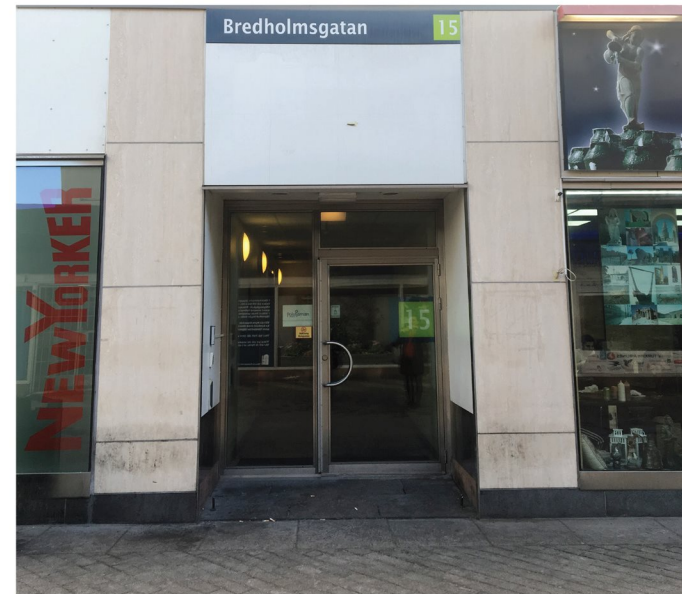
5. Bredholmsgatan 15. Ingång till Skärholmen centrum via Bredholmsgatan.