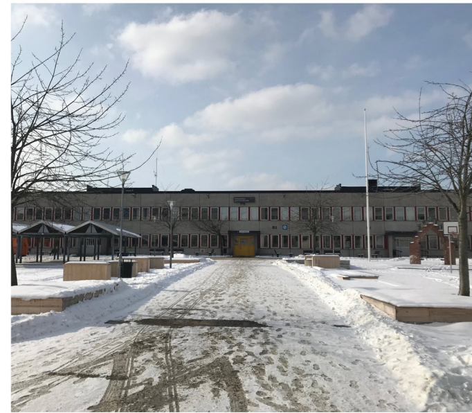
2. Bredholmstorget. Skärholmens gymnasium entré mot torget.