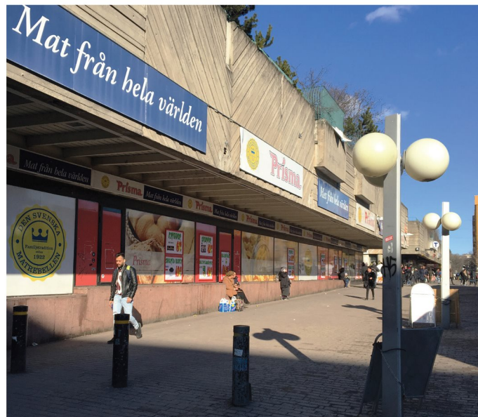
4. Skärholmsgången. Bottenvåning.