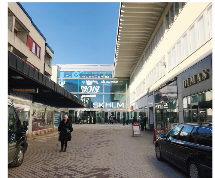
9. Bredholmsgången. Köpcentrumets sydvästra entré.