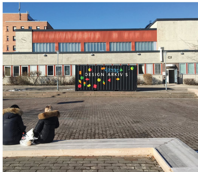
7. Bredholmstorget. Design-lab.