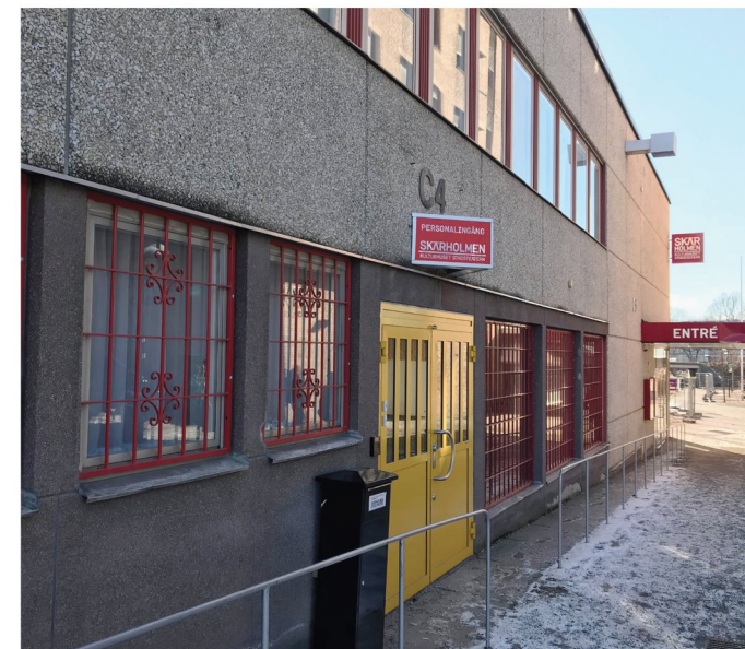
5. Bodholmsgången. Kulturhuset, stadsteatern.