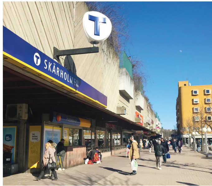
1. Skärholmstorget. Tunnelbaneuppgång Skärholmen.