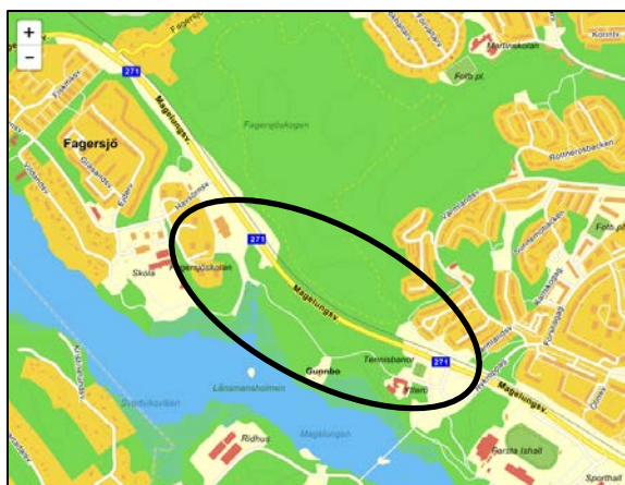
Bild visar inringat området där markvibrationer mätts upp