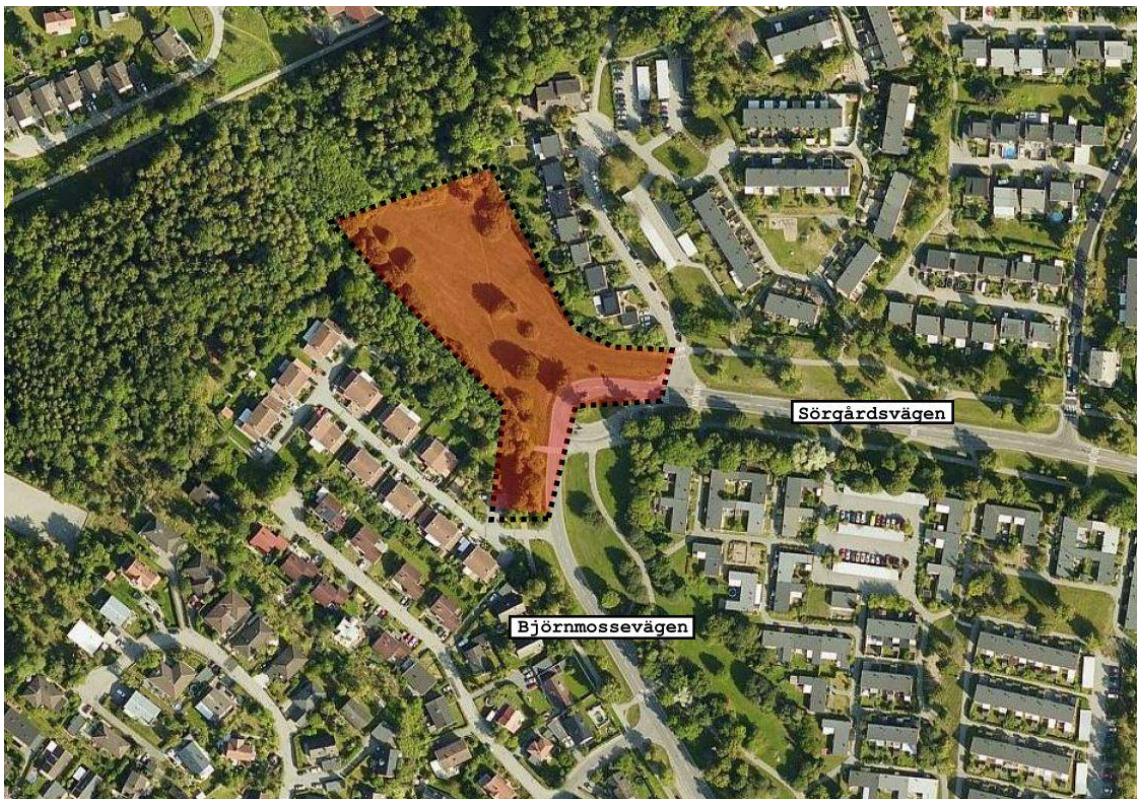
Figur 1: Ungefärligt detaljplaneområde markerat i rött ( www.eniro.se , 2018-12-04)

Detaljplaneområdet ligger norr om kurvan där Björnmossevägen och Sörgårdsvägen möts, i Kälvesta i Stockholm. Se Figur 1 för detaljplaneområdets ungefärliga omfattning.