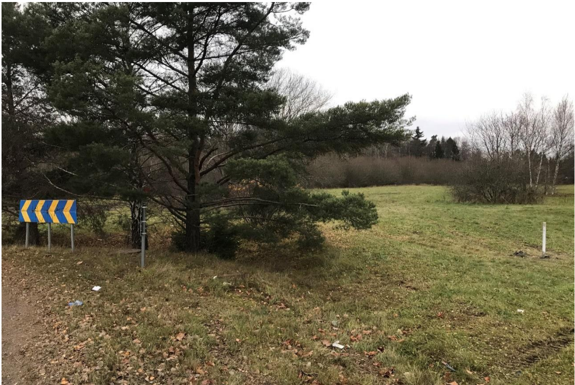
Figur 3: Foto taget som visar grönytan som utgörs största delen av detalplaneområdet och visar gräsytan och de kringliggande träden. Fotot är taget mot norr.