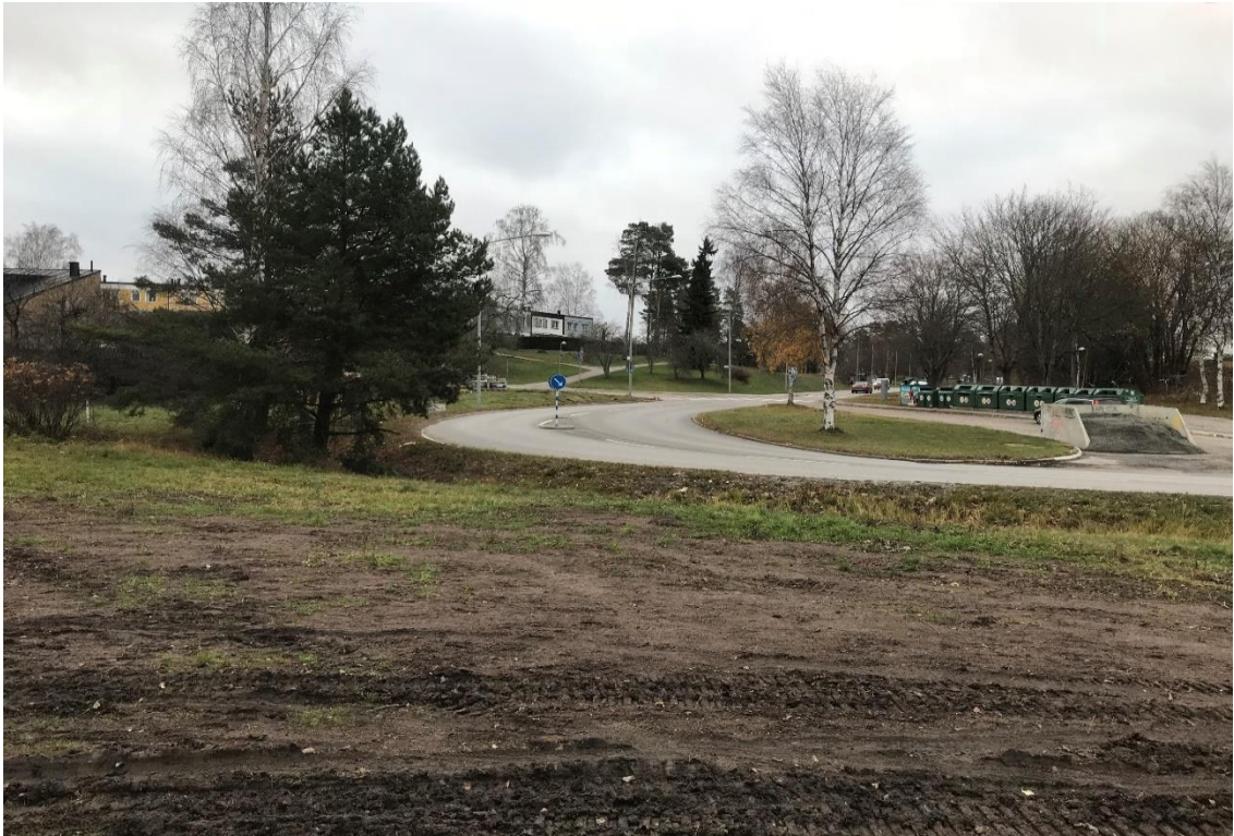
Figur 2: Foto som visar vart Sörgårdsvägen (till vänster) och Björnmossevägen (till höger) möts. Fotot tagen mot söder.